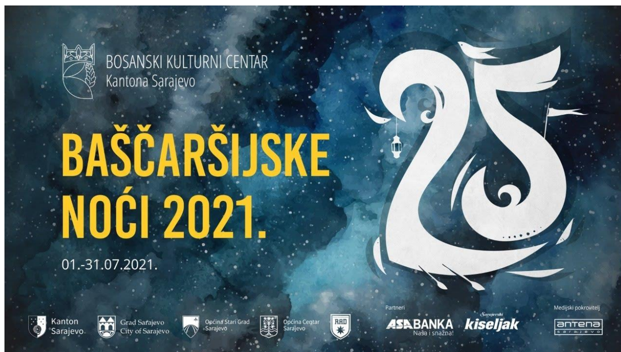
Slika 3. Najava za Bašćaršijske noći, 2021. godina