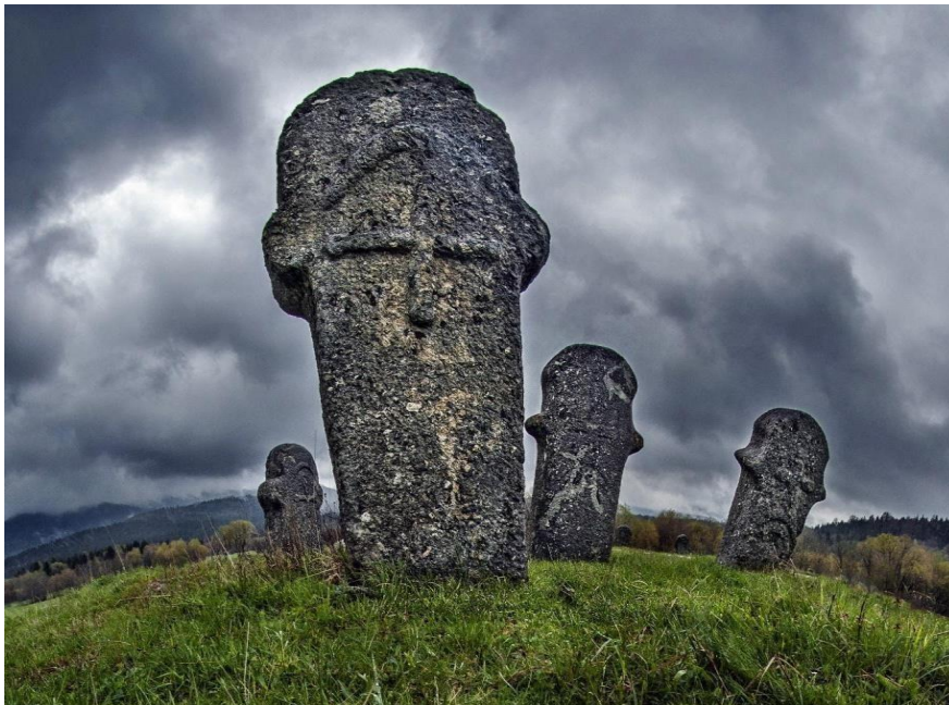
Sl. 10. Prikazuje stećke nekropole Maculje