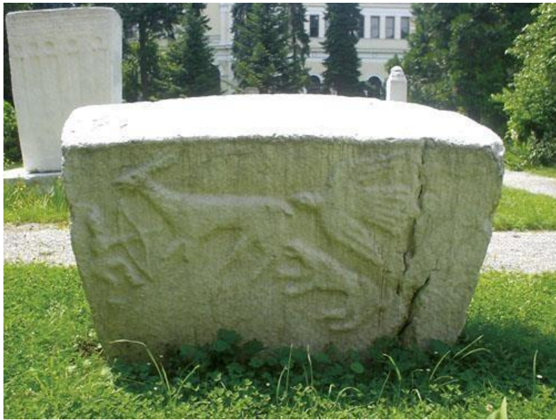
Sl. 11. Primjer životinjskog motiva

U stećcima se pojavljuju cvjetne grane, lisnate i rascvjetane trake do kombinacija usamljenih i opustošenih drveća i cvijeća, tako je na primjer spirala s grozdovima u kompoziciji sa križem ukrasila spomenike pored Srebrenice. Također, pojavljuje se dosta predstava drveta koji su prožeti određenom dubljom simbolikom. ( Miletić, 1982).