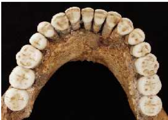
Slika 9. Rekonstrukcija neandertalskih zubiju izložena na Kraljevskom Belgijskom institutu za prirodne znanosti u Bruxellesu.