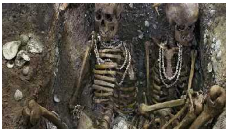
Slika 4. Kosturi dvije žene, Brittany, Francuska

Danas se mnogo znanstvenika slaže da su neandertalci imali neke osobine modernog čovjeka: simboliku, kulturno definiran sustav, možda i jezik te duhovnost. Neandertalci su na tlu današnje Europe opstali više od 150000 godina, dok smo mi kao predstavnici modernih ljudi ovdje tek oko 40000 g, što dokazuje da su se jako dugo uspješno prilagođavali promjenama u klimi i okolišu. U srednjem paleolitiku nalazimo tragove upotrebe boja, skupljanje lijepih predmeta, npr. školjki, i grube gravure u predmetima, u gornjem paleolitiku bi se već moglo govoriti o umjetnosti neandertalaca. Također je u gornjem paleolitiku u 88% slučajeva ustanovljeno postojanje grobnih priloga, dok je u donjem taj postotak iznosio 33%, što ukazuje na potencijalnu duhovnost (slika 4). Postoje i nalazi nakita u šatelperonijeu kulturi, no ne može se utvrditi jesu li do tog nakita došli razmjenom s već pristiglim modernim ljudima iz Afrike ili su ga sami izrađivali.