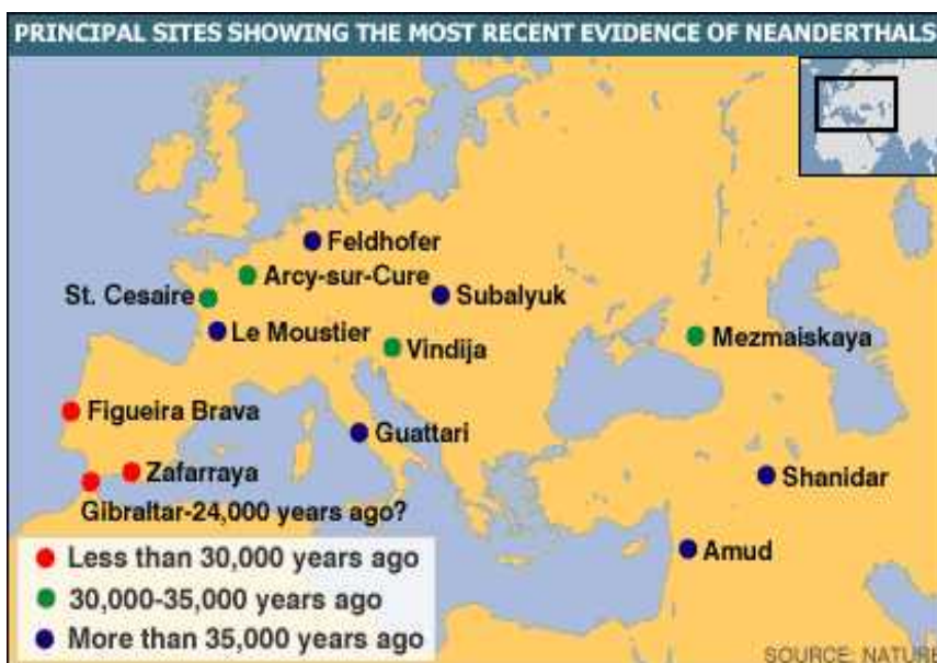
Slika 3. Nalazišta neandertalaca

Dijele se na starije ili predneandertalce i klasične neandertalce. Stariji neandertalci živjeli su u posljednjem interglacijalu, pa se nazivaju i predwürmski neandertalci. Nalazišta sa ostacima njihovih kostiju, kostiju životinja koje su koristili za jelo, te njihovog oruđa pronađeni su u Njemačkoj, Italiji, Slovačkoj, u Hrvatskoj u Krapini, te na još nekoliko lokaliteta. Klasični neandertalci živjeli su u vrijeme posljednje oledbe, pa se nazivaju i würmski neandertalci. Njihova nalazišta nalaze se u Neanderthalu, Francuskoj, Italiji, Bliskom istoku, Španjolskoj, i u Hrvatskoj u špilji Vindija. Bili su crvenokosi, s pjegicama na licu, niži, no i snažniji od današnjeg čovjeka, iste vrste, robusne građine tijela uvjetovane velikom fizičkom aktivnošću. Njihova kultura naziva se musterijska kultura.