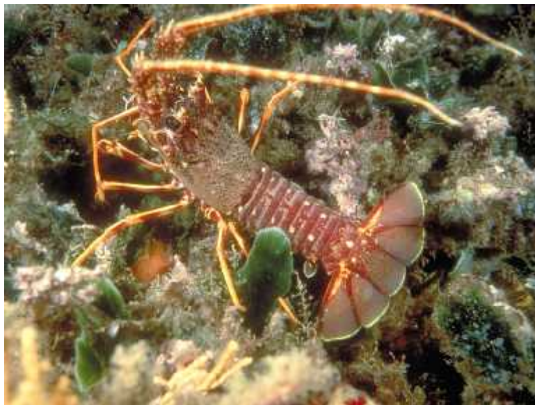
Slika 1. Jastog

brže rastu u toplijim vodama. Jastozi nalikuju hlapovima ( Homarus gammarus ), ali za razliku od njih nemaju kliješta, a stražnja ticala su im vrlo duga ka, duža od tijela. Oklop im je obično s lijeve strane naranaste boje, s tamnijim dugim i vrstnim trnovima usmjerenim prema naprijed, dok im je trbušna strana svijetle (bijele) boje, ali zabilježeni su i crveno-ljubiasti i smeđi primjerci. Hodaju po morskom dnu, ali mogu i plivati (Slika1). Svejedi su, iako se njihova prehrana uglavnom temelji na bodljikašima, mekušcima (puževima i školjkašima), ali inkama kozica, koluti avcima, mahovnjacima i algama. Socijalne (društvene) su životinje (sakupljaju se u skupine), ali njihovi međusobni socijalni kontakti nisu dobro proučeni. Na njima se mogu prikrivati i živjeti neki mnogo vrstni etinaši (cjevaši), školjkaši, mahovnjaci i rakovi lupari. Brojnost populacija jastoga se znatno smanjuje što se vidi u smanjenom ulovu i prosječno manjoj duljini ulovljenih jastoga. Razlozi tomu su mnogobrojni: od prekomjernog izlova do promjene ekoloških uvjeta na njihovim staništima.