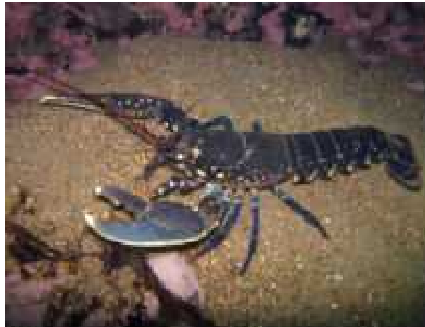
Slika 3. Hlap

Hlap ( Homarus gammarus ) je morski deseteronožni rak, poznat i pod nazivima lap, karlo, rarog, njakar, humer i ralog. Rije hlap zna i „težak momak koji vu e noge“ i on zaista vu e štípaljke po dnu proizvode i pritom karakteristi an zvuk. Tijelo je u osnovi žuto i posuto je manjim modro-crnim mrljama me u kojima se mogu na i crveno-sme e i ljubi aste mrlje. Ima svojstvena velika i jaka kliješta koja mogu biti razli itih oblika. Glavopršnjak i zadak su glatki i nemaju izrasline, a oklop je jak. Kliješta su mu izrazito velika i služe mu za rezanje i drobljenje plijena. Ima i manja kliješta koja mu služe za hranjenje i obranu (Slika 3). Može narasti do jednog metra i biti težine do 9kg, a prosje ni su primjerci dugi oko 40 cm i teški oko 1 kilogram. Najve i ulovljeni ikad bio je dug 1.26 m i težak 9.3 kg i kao takav je ušao i u Guinnessovu knjigu rekorda.