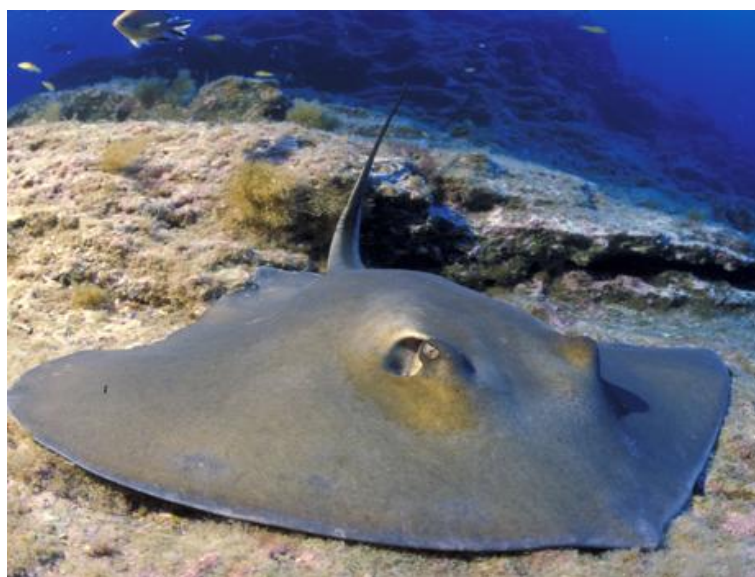
Slika 5. ŽUTUGA ( Dasyatis pastinaca )