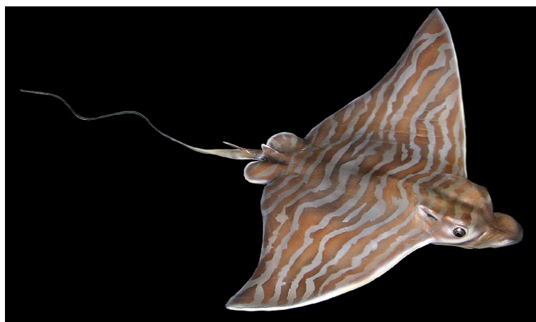
Slika 3. GOLUB ĆUKAN ( Pteromylaeus bovinus )

Golub ćukan (Slika 3.) je izgledom dosta sličan kosiru, ima nešto dužu njušku, ali najviše se razlikuje po tome što ima desetak tamnih poprečnih pruga po leđima koje kod starijih primjeraka gotovo nestaju. Voli nešto veće temperature pa je češći u južnom dijelu Jadrana. Semipelagična je, priobalna vrsta. Naraste preko 2 m u dužinu i do 80 kg. Tijelo mu je spljošteno kao i kod svih goluba, s izduljenim bočnim perajama, kao krilima koje završavaju oštro. Ima izduljenu njušku, ravnu, koja podsjeća na pačji kljun, u ustima ima 7 redova ravnih zuba. Svijetlo smeđe je boje. Rep je vrlo dug i završava poput dugačkog biča. Bodlja je velika i dobro razvijena i nalazi se uz sam početak repa. Ponekad se nađu primjerci s dvije ili više bodlji u repu. Bodlja je izgrađena od tvrdog, kosti sličnog materijala (vazodentin). Duž bodlje postoji duboki žlijeb u kojem se nalazi otrovno žljezdano tkivo. Otrovnost se stvara i u ovojnici bodlje, a također i u koži repa uz bazu bodlje. (Wölfl, 1994)