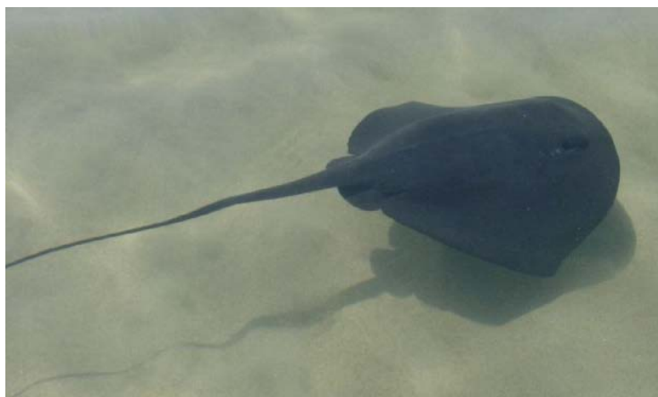
Slika 6. LJUBIČASTA ŽUTUGA ( Dasyatis violecea )

Ljubičasta žutuga (Slika 6.) živi najdublje i dosta je rijetka u Jadranu. Kozmopolit je u tropskim i suptropskim morima, a najbrojnija je na obalama Indonezije. U Mediteranu je difuzno rasprostranjena. Pelagička je i sedentarna vrsta, živi do 250 m dubine. Odozgo je tamnoljubičasta, kako i samo ime kaže, a odozdo svjetlija sa smeđim obodom prsnih peraja. Hrani se manjom ribom i beskralješnjacima, uključujući i meduze. Rep je dugačak i bičast s jednom ili dvije harpunasto nazubljene bodlje te kratkim i uskim kožnim naborom odozgo. Bodlje na repu treba se čuvati jer je otrovna (Jadras, 1996).