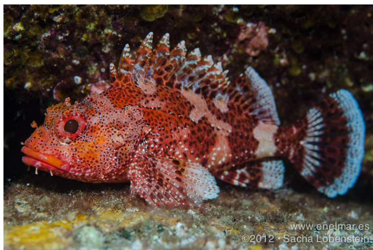
Slika 16. BODEČNJAK ( Scorpaena maderensis )

Kod nas se još naziva i mali bodečnjak (Slika 16.). Ovo je mala riba, težine do 150 g, najveći primjerak uhvaćen je imao 14 cm. Boja mu je crvenkastosmeđa s nekoliko tamnijih pojasa po tijelu, ovisno o bojama i obliku dna okoline. Živi na kamenitom terenu, na dubinama 20-40 m, gdje je vrstan grabežljivac koji se hrani manjim životinjicama i ribama. Kao i većina riba iz svoje porodice i ova riba ima otrovan ubod, vrlo bolan. Kod nas je najčešći na južnom Jadranu. Iako je jestiva, zbog svoje veličine i velikog broja sitnih drača, nema značajniju ulogu u prehrani ( www.hr.wikipedia.org ).