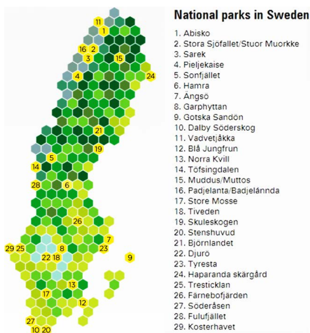
Slika 10. Popis nacionalnih parkova i njihov geografski položaj; zelene boje označavaju različitu vegetaciju (listopadne i borealne šume), svijetlo plava jezera, a plavo-sive nijanse visoke planinske predjele (The official site of Sweden 2015)

Nacionalni parkovi, rezervati prirode i ostala područja zaštite prirode zauzimaju područje od 4,2 milijuna hektara. Prvi nacionalni park u Europi bio je u Švedskoj, a proglašen je 1909. Danas je Švedska druga u Europskoj Uniji po broju nacionalnih parkova sa njih 29, odmah iza Finske koja ih ima 37. Švedska ima više od 4000 rezervata prirode, koji zajedno s nacionalnim parkovima pokrivaju desetinu švedskog kopna ili čitavu Dansku (Sl. 10.). 2012. godine više od 80% Šveđana živjelo je unutar 5 kilometara od nacionalnog parka, rezervata prirode ili područja neke druge vrste zaštite prirode (The official site of Sweden 2015).