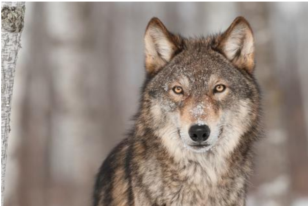
Slika 6. Vuk u Švedskoj (Wild Sweden 2015)

jedinki. Prema podacima iz 2015. broj im je porastao na oko 250 jedinki (The official site of Sweden 2015). Unatoč tome i dalje su zaštićena vrsta (Sl. 6.). Vukovi su društvene životinje i žive u čoporima koje čine par roditelja, poznati i kao alfa par, i njihovi potomci. Većina potomaka napušta čopor prije zrelosti no neki ostaju i imaju ulogu dadilja. Teritorij čopora, koji je obično veličine 800-1000 km 2 , obilježava samo alfa par. Borbe oko teritorija među čoporima nisu rijetkost i ponekad završavaju smrću (Nature Travels: Outdoor Holidays in Sweden, Norway & Finland 2015). Uglavnom se hrani losom te jedan čopor vukova godišnje ubije otprilike 120 jedinki losa (The official site of Sweden 2015).