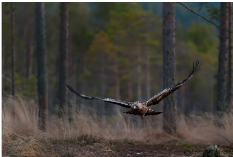
Slika 7. Suri orao u letu; šume u okolici Kalvträska, Švedska