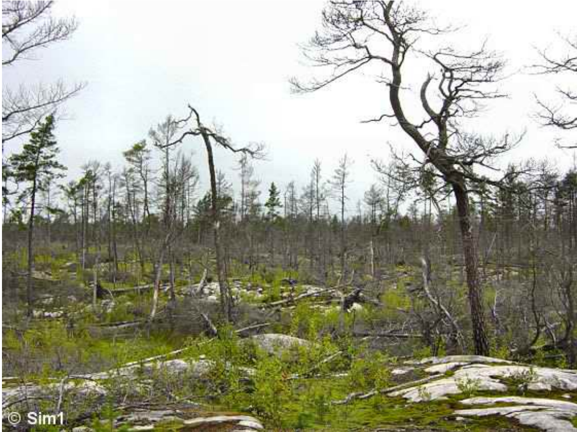
Slika 3. Posljedice požara u nacionalnom parku Tyresta (Sim1 Travels 2011)

Požari ubijaju relativno mali broj divljih vrsta životinja direktno. Veliki utjecaj požara na divlje životinje leži u promjeni njihovog staništa. Bilo koja značajna promjena u staništu sigurno će na neke vrste utjecati pozitivno, a na neke negativno. Šumski požari obično konzumiraju 10-20 % drveta u deblu, ostavljajući tako mnogo mrtvih uspravnih debala. Takva debala su dobro stanište za djetliće koji traže kukce koji žive u mrtvom drveću i ptice koje se gnijezde u šupljinama koje su izdubili djetlići. Jelen i los također preferiraju mlade šume nakon požara. Idealno bi bilo kada bi se redovito javljali relativno mali požari te bi na taj način uvijek postojala mješavina mladih, srednjovječnih i zrelih staništa sa prisutnim svim vrstama koje se mogu javiti na tom staništu (Robinson 2002). Nažalost, od 19. stoljeća kroz upravljanje šumama mrtva su stabla odstranjivana, a danas osim što se takva stabla i dalje uklanjaju, najvažniji je faktor gotovo potpuni prestanak požara uslijed aktivne zaštite od požara. Takvo upravljanje šumama dovelo je do ozbiljnog problema s obzirom da opstanak mnogih vrsta, uključujući rijetke vrste ptica, kukaca, lišajeva i gljiva ovisi na dostupnosti ovakvih vrsta staništa (Sweden – forests and forestry 2001).