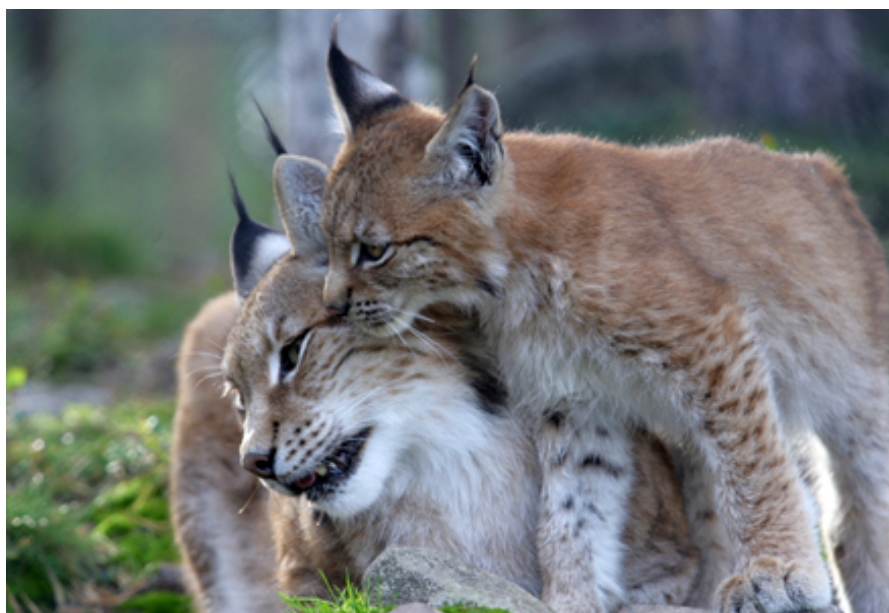
Slika 8. Ris sa mladuncima u Švedskoj (Rovdjurscentrum & Designtorg Trä och Orsa Rovdjurspark 2015)

Ris je najveća vrsta divlje mačke u Europi – "tigar sjevera". Procjene populacije variraju, ali od ukupne skandinavske populacije od oko 2000 jedinki, otprilike 1500 ih živi u Švedskoj (Nature Travels: Outdoor Holidays in Sweden, Norway & Finland 2015). Većinom nastanjuju sjeverne i srednje dijelove Švedske, ali ponovno šire svoj teritorij prema jugu kako bi osvojili svoja stara staništa. Uglavnom se hrane sobovima ili jelenima, a izgladnjivanje je najčešći uzrok smrti kod mladunčadi (Sl. 8.) (The official site of Sweden 2015).