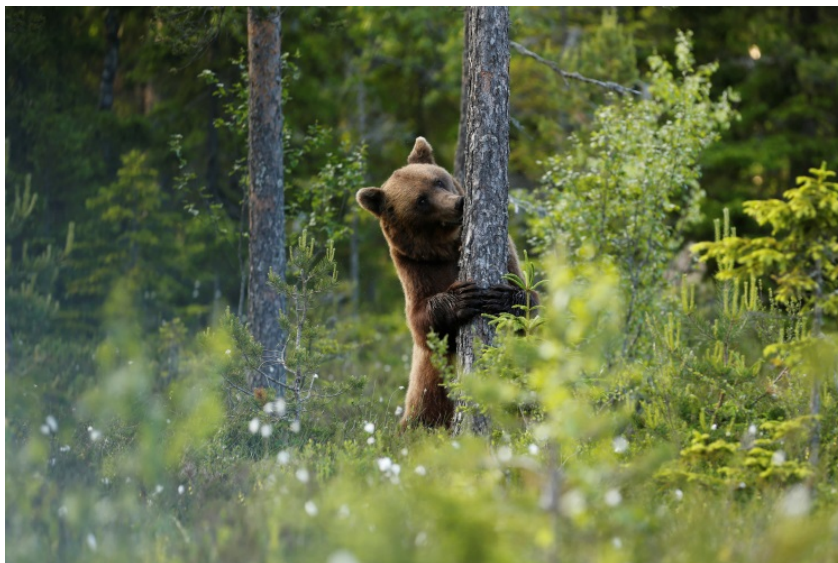
Slika 4. Smeđi medvjed u Švedskoj (The official site of Sweden 2015)

Smeđi medvjedi, koji nastanjuju šume i planine Švedske, danas su zaštićena vrsta. U divljini, mužjak može doseći težinu do 350, a ženka 240 kg (Sl. 4.). Smeđi medvjed je sramežljiva, tajnovita i vrlo rijetko viđena životinja. Smeđi medvjedi su široko rasprostranjeni u sjevernom dijelu države, a postoje i naznake da se njihovi areali šire. Studija iz 2004. godine procjenjuje švedsku populaciju između 1635 i 2840 jedinki, sa godišnjim rastom populacije od 4,7%. Ista studija je dala podatke o raspodjeli populacije u državi. Medvjedi su svejedi koji hiberniraju u jazbini gdje tijekom zime na svijet dolaze mladunci u leglima od 1-4 jedinki. Mladunci su slijepi, bespomoćni i teže 300-400 g, ali brzo rastu zahvaljujući prehrani bogatim mlijekom pa su sa 6 mjeseci spremni za samostalan život (Nature Travels: Outdoor Holidays in Sweden, Norway & Finland 2015).