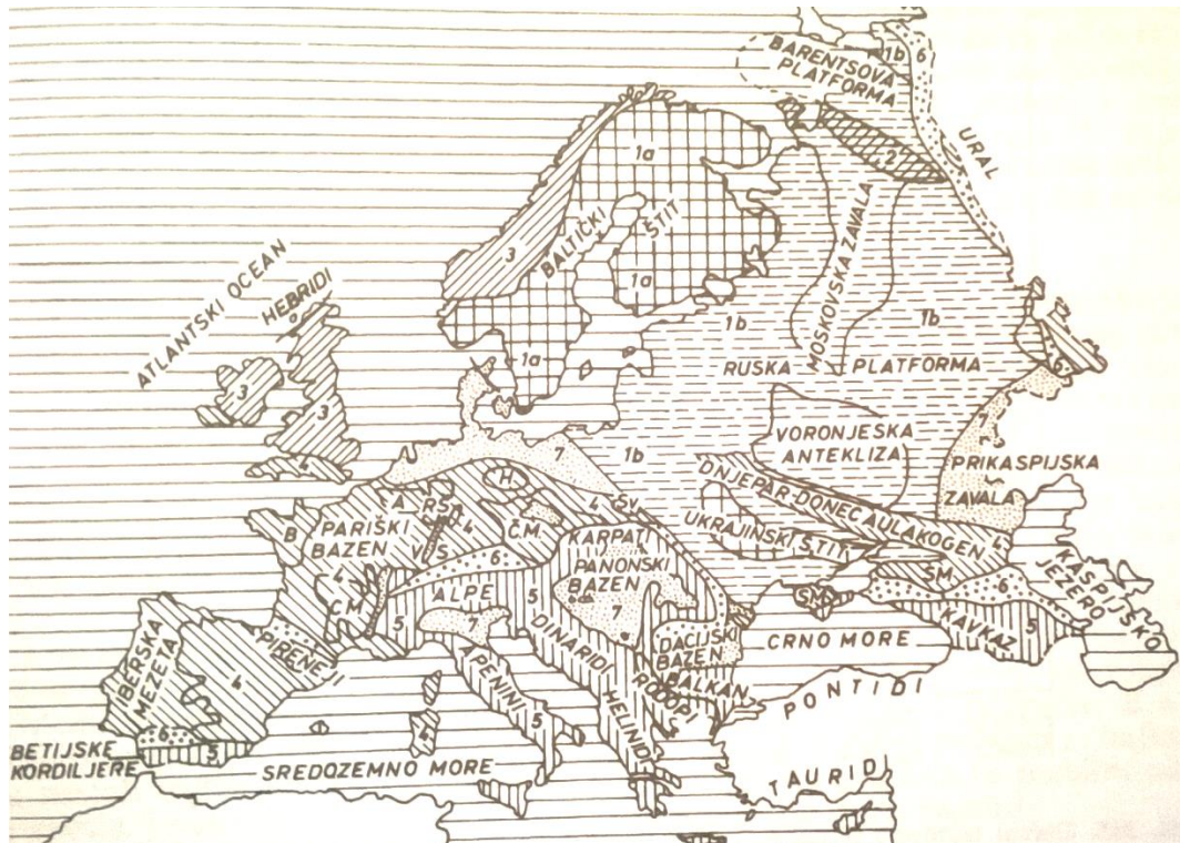
Slika 1. Glavni tektonski pojasevi Europe (Herak 1990)

Geološku podlogu Švedske čini Baltički štit. Obuhvaća staro baltičko ispupčeno područje u kojem prekambrijske stijene dopiru do površine ili su pokrivene tanjim pokrivačem koji se uglavnom sastoji od kvartarnih naslaga, a samo su manje prisutni sedimenti paleozoika, mezozoika i tercijara (Sl. 1.) (Herak 1990).