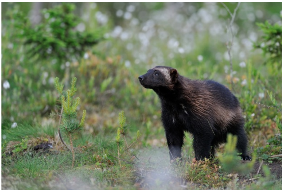
Slika 5. Žderonja u Švedskoj (Wild Sweden 2015)

Žderonje ili gorske kune su najmanje poznati i najtajnovitiji veliki predatori Švedske, a spadaju u porodicu kuna zajedno s jazavcima i vidrama. Nazivali su ih "hijenama sjevernih planina" s obzirom da su većinom strvinari te prilično loši predatori. Populacija u Švedskoj broji oko 650 jedinki i iako obično obitavaju u sjevernoj Švedskoj, u potrazi za hranom u posljednje se vrijeme šire na jug (Sl. 5.) (The official site of Sweden 2015). Jedinke ove vrste obično narastu 70-85 cm dužine sa repom dužine 20 cm, a odrasli teže gotovo 20 kg. Parenje se odvija od travnja do kolovoza, a u veljači ili ožujku na svijet dolazi 1-4 mladunca. Zimi se hrane sobovima, a ljeti malim glodavcima, pticama i biljem. Najaktivniji su noću te u sumrak i zoru. Zaštićena su vrsta. Od 1993. godine provodi se projekt, čija je svrha proučavanje vrste unutar i u okolici nacionalnog parka Sarek u Laponiji, velikog planinskog područja često zvanog 'posljednja divljina Europe', s ciljem zaštite vrste. U istu je svrhu ukupno uhvaćeno 168 jedinki i opremljeno s radio odašiljačima kako bi se znanstvenicima omogućilo da prate njihovo kretanje i ponašanje (Nature Travels: Outdoor Holidays in Sweden, Norway & Finland 2015).