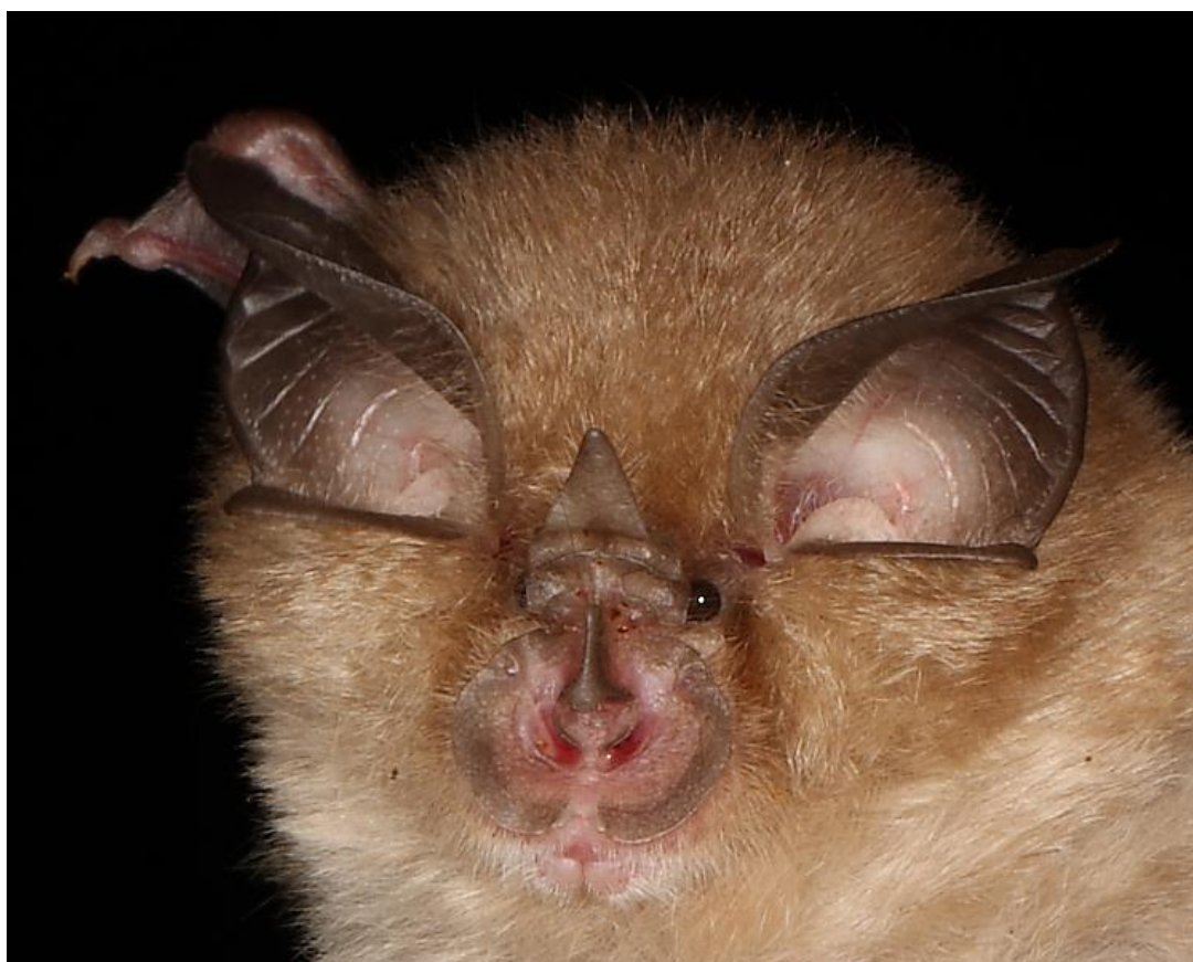
Slika 4.7.1 - Rhinolophus hipposideros

On je najmanja europska vrsta šišmiša. Gornja strana tijela im je sivo-smeđa dok je donja strana sivo-bijela. Parenje započinje u jesen i završava na proljeće uz pauzu zimi. Ženske se često pare odmah nakon zimskog sna u prostoru gdje su prezimile. U proljeće kote mladunce koje već u prvom tjednu vode sobom u lov. Love noću u zajednicama između stabala na visini tik od tla pa do pet metara. Hrani se komarcima, manjim noćnim leptirima, tvrdokrilcima i manjim paukovima. Zimovališta su im u špiljama, rudnicima i podrumima. Ljetne kolonije su u potkrovljima zgrada i crkvenim tornjevima. Razlozi potencijalne ugroženosti su osjetljivost na uznemiravanje kolonija u skloništima, obnova zgrada na način da mali potkovnjak gubi svoja tradicionalna skloništa, promjene u krajoliku koji koristi za sklonište te lov. Potencijalno je ugrožen i impregnacijom drvene građe za krovništa otrovnim spojevima. Mali potkovnjak je također među prioritetnim vrstama EUROBATs-a. (Crvena knjiga sisavaca, 2006)