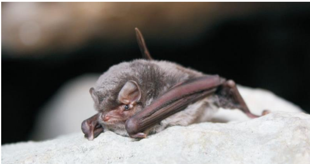
Slika 4.1.1 - Vrsta Miniopterus schreibersii

Dugokrili pršnjak (Slika 4.1.1) šišmiš je srednje veličine čija boja tijela varira od sivo-smeđe do pepeljasto smeđe, te svjetlije sive s trbušne strane. Na relativno maloj glavi smještene su kratke i trokutaste uši te izrazito kratka njuška. ( www.dzpz.hr ). On je primarno špiljska vrsta, no pronađen je i u rudnicima te napuštenim podrumima. Vrsta je izrazita selica te može preći i preko 1.300 km. Porodiljske kolonije isključivo su vezane uz špilje ili napuštene rudnike. Ženka kraljem proljeća rađa najčešće jedno mlado. Odlaze u lov tik nakon zalaska sunca. Love na otvorenom području na visini od 10 do 20 m. Plijen su im noćni leptiri, komarci, mušice i paukovi. Hibernacija započinje u listopadu i traje do ožujka. Provode je u špiljama zajedno s drugim vrstama šišmiša. Uz sivog dugoušana ( Plecotus austriacus ) i dugonogog šišmiša ( Myotis capaccinii ) on je najugroženija vrsta u Hrvatskoj. Vrsta je izrazito osjetljiva na uznemiravanje te je ugrožena ljudskim aktivnostima što vodi do gubitka skloništa u špiljama. Ostali razlozi ugroženosti su upotreba pesticida čime im se ograničava izvor hrane te nestanak porodiljskih kolonija i smanjenje broja jedinki u porodiljskim kolonijama koje su opstale.