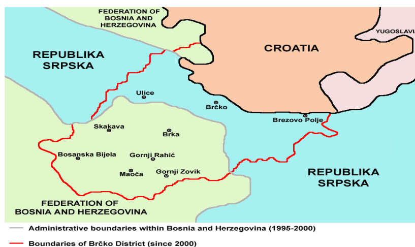
Slika 4. Položaj distrikta u odnosu na entitete i susjedne države

Bosna je oduvijek bila raskrižje kultura i mjesto sukobljavanja susjednih središta moći. Upravo zbog svog položaja uvijek je imala nestabilnu državnu organizaciju, bez obzira u čijem sastavu je bila. Značajka Bosne je položaj uz smjerove velikih prodora: bila je klin turskog prodora u Europu i zemlja prve linije austrougarskog prodora na istok. U Jugoslaviji dobiva drugačiji položaj, postaje jezgra ali samo u prostornom i geostrateškom smislu, ne i u političkom. Gravitacijski Bosna je sa sjevera, zapada i juga upućena na Hrvatsku prema kojoj se široko otvara iz svoje gorske jezgre. Takva veza sa istočne strane, tj. sa Srbijom ne postoji zbog rijeke Drine koja predstavlja prepreku (Klemenčić, 1997).