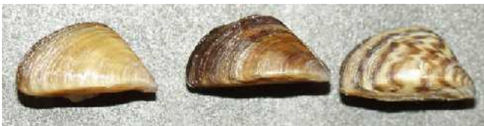
Slika 5. Vrsta Dreissena polymorpha - različita koloracija školjke (en.wikipedia.org)

Vrsta raznolikotrokutnja školjka Dreissena polymorpha , je mali školjkaš iz reda Veneroidea. Sama školjka može znatno varirati bojom, ali uvijek ima oblik nepravilnog trokuta (sl. 5).