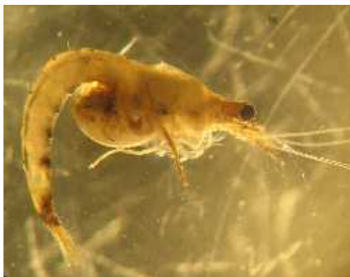
Slika 4. Vrsta Lymnomyxis benedeni (Semenchenko et al., 2007)

Za razliku od mnogih, ova je vrsta namjerno unesena u zapadne slatkovodne sustave. Sredinom 20. st. donesena je u Dnjepar te u jezero Balaton kao hrana za riblju mlađ. Kasnije se proširila i u Dunav te dalje u europske rijeke, uključujući i Dravu.