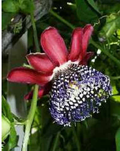
Slika 5. cvijet goleme pasiflore

( http://www.exotischezaden.nl/exotische_zaden/images/Passiflora-quadrangularis.jpg )