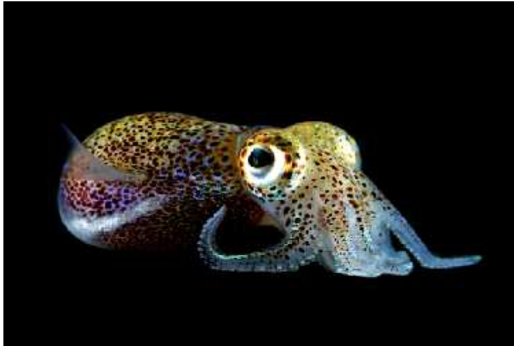
Slika2: Bioluminiscencija vrste Euprymna scolopes , preuzeto sa

prekriveni pigmentima kromatofora kada ih životinja ne želi pokazati, ali mehanizam još nije poznat.