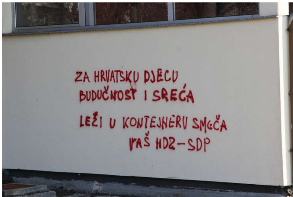
Sl.9.: Grafit u Slavonskom Brodu 2018. godine