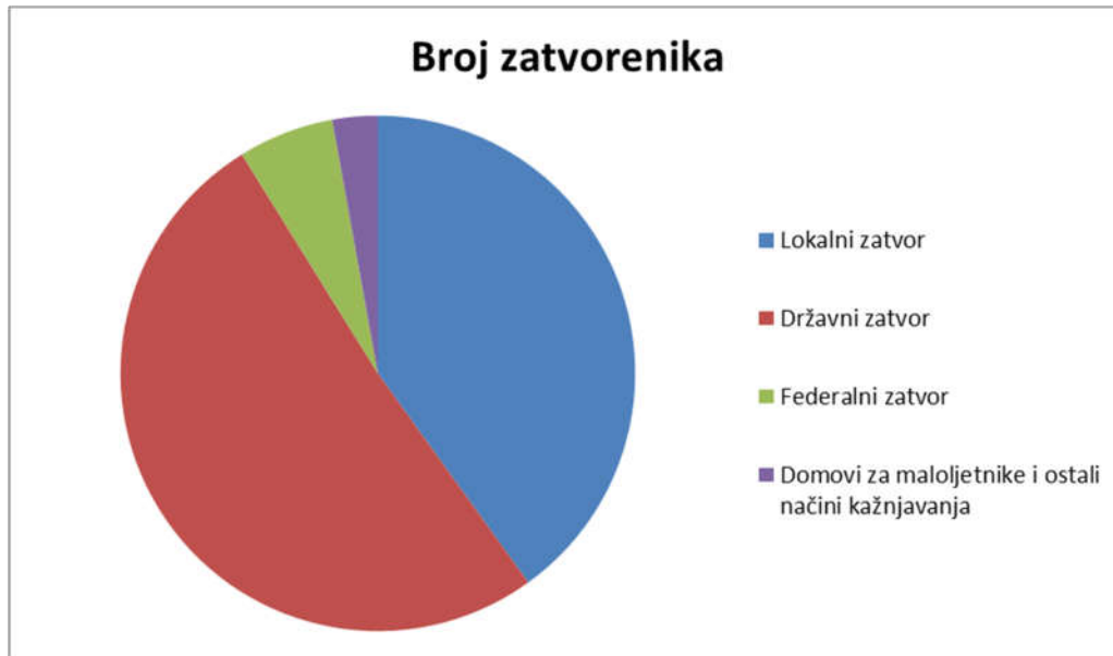
SI.3.: Omjer broja zatvorenika po raznim ustanovama za kažnjavanje u Pennsylvaniji 2016. godine

ovih prostora, Meek Milla. Mnogi upozoravaju, da se takva masovna zatvaranja ne događaju samo u rap glazbi, već da treba obratiti pozornost da je to problem čitave afroameričke (isto tako i latinoameričke) zajednice diljem SAD-a“ (Owens, 2017).