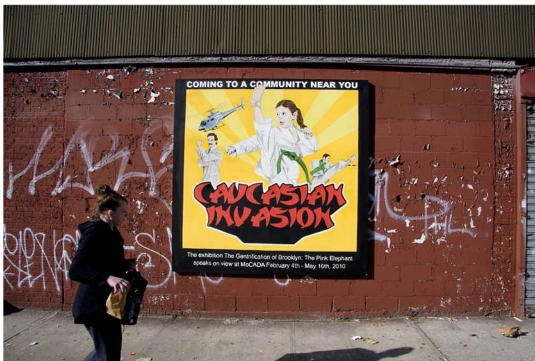
Sl.2: Reklama za izložbu o gentrifikaciji Brooklyna, New York City, 2010. godine, nazvana: „Bjelačka invazija“