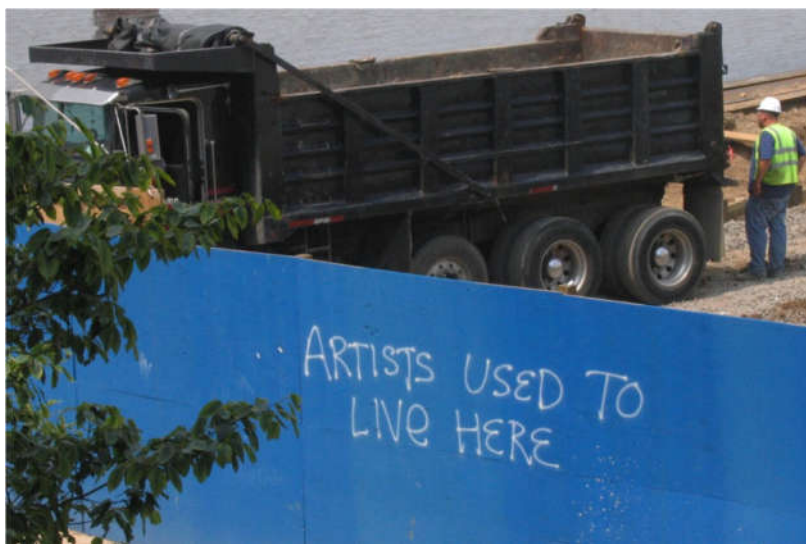
SI.1.: Grafit u Brooklynu, New York City: „Umjetnici su ovdje živjeli“

Kako je hip-hop žanr postigao popularnost, postao je komercijaliziraniji. Drukčije rečeno, hip-hop i rap umjetnici izgubili su kreativnu sposobnost da govore o ozbiljnim društvenim pitanjima velikog značaja, a glazbena industrija ih sve više potiče (možda čak i tjera) na stvaranje glazbe koja se lakše prodaje široj (i bjeljoj) publici. Zbog komercijalizacije hip-hop glazbe, prava svrha te glazbe često se previdi ili trivijalizira temama seksa, droga i nasilja, koje nose komercijalnu prednost nad društveno svjesnim temama. Budući da je hip-hop postao više trivijalna tema nego politički komentar na društvenu promjenu kao reakciju na komercijalizaciju, stereotipi koje Bijelci drže za Afroamerikance su ojačani. Ovdje se govori o gentrifikaciji hip-hop kulture. To predstavlja na primjer „izbjeljivanje“ četvrti New Yorka, Brooklyna, jer je odjednom postalo cool živjeti tamo, te istovremeni gubitak utjecaja hip-hop kulture kao oblika umjetnosti i kao sredstvo otpora (SI.1. i SI.2.). „Kada je hip-hop kultura prisutna, ona je također nevidljiva. Kada je sveprisutna, onda je nigdje“ (Questlove, 2014).