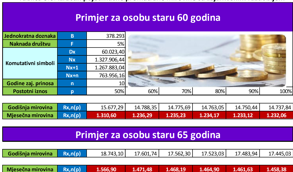
Tablica 3.6. Izračun pojedinačne promatrane mirovine sa zajamčenim razdobljem

Posebnost ovog tipa mirovine jest što uvodi dva nova parametra koji utječu na visinu mirovine. Kao što je i za pretpostaviti, veći broj godina zajamčenog prinosa odražava se u vidu smanjenja buduće godišnje, odnosno mjesečne mirovine. Također, povećanje postotnog iznosa mirovine koji se, u slučaju smrti korisnika mirovine, isplaćuje imenovanom korisniku u zajamčenom razdoblju do isteka tog razdoblja kao što vidimo iz prethodnog izračuna rezultira laganim padom godišnje odnosno mjesečne mirovine.