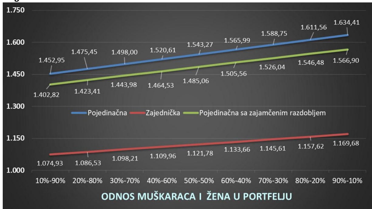
Grafikon 4.3. Kretanje mirovina u ovisnosti o omjeru muškaraca i žena u portfelju osiguranika