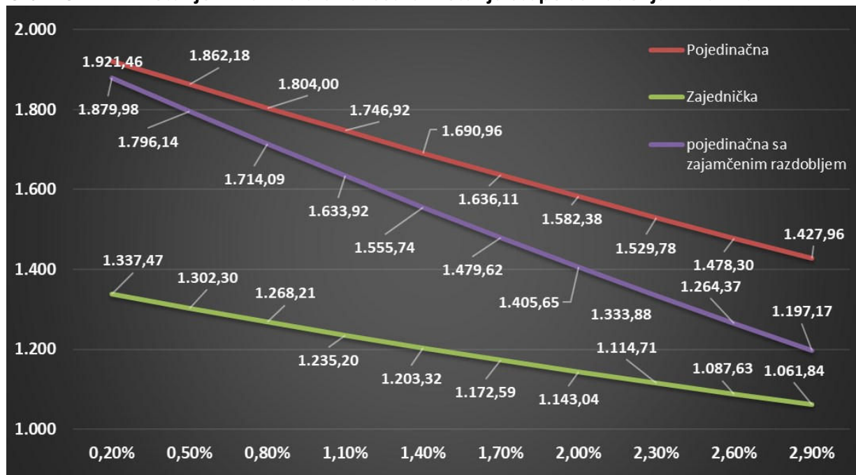
Grafikon 4.1. Kretanje mirovina u ovisnosti o kretanju stope usklađenja mirovina

Nadalje u nastavku je dan grafički prikaz kretanja mirovina u ovisnosti o kretanju stope usklađenja mirovina.