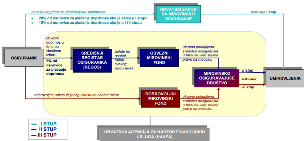
Slika 2.1. Struktura mirovinskog sustava