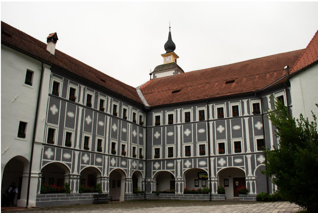
Sl. 17. Dvorište samostana Olimje, Olimje