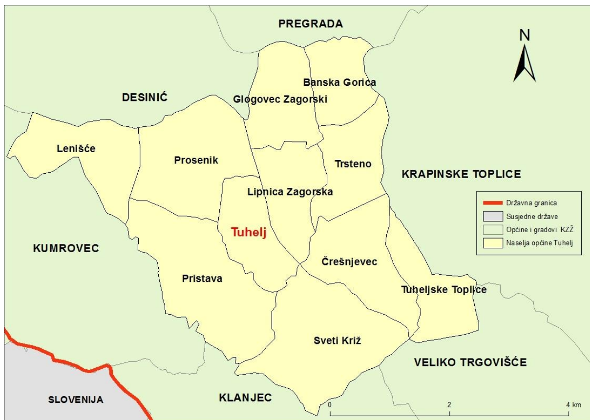
Sl. 1. Naselja Općine Tuhelj i susjedne općine