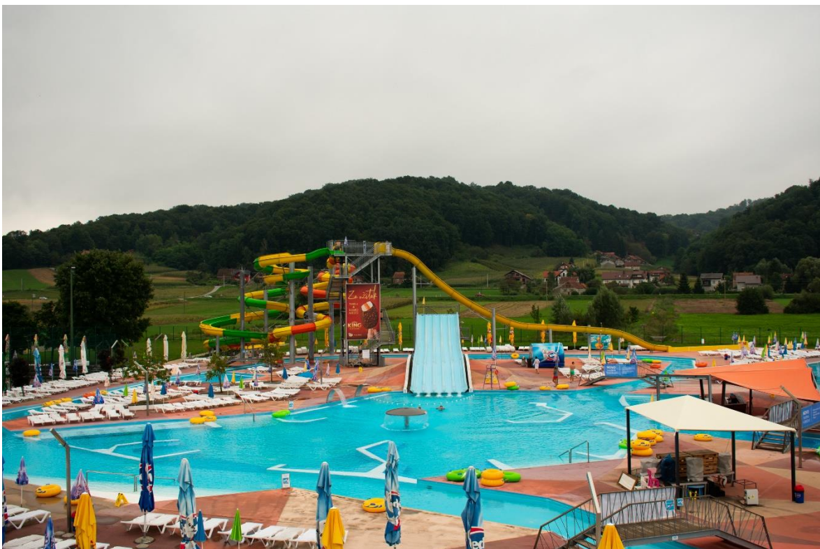
Sl. 9. „Vodeni planet“, „Terme Tuhelj“

Nakon usporedbe ponude smještaja analizirana je ponuda kupališno-zabavnih sadržaja. Ponuda kupališno-zabavnih sadržaja odnosi se na bazene i s njima povezane atrakcije, primjerice tobogane. Glavninu kupališno-zabavne ponude „Terme Tuhelj“ čini „Vodeni planet“. „Vodeni planet“ obuhvaća 8 unutarnjih i vanjskih bazena ispunjenih termalnom vodom ukupne vodene površine veće od 5 000 m 2 . Vanjsko kupalište sastoji se od bazena s valovima, dječjeg bazena s 4 tobogana i vodenim topovima, bazena za najmlađe uzraste s vodenim igračkama, relaksacijskog bazena s gejzirima, vodenim tornjevima i podvodnom masažom. Ponuda vanjskog kupališta uključuje i tobogan s 5 traka za spuštanje, 2 adrenalinska tobogana te tobogan „Kamikazu“. Bazeni su povezani kanalom dužine 250 m koji ima 2 lagune i podvodne masaže. Vanjski dio „Vodenog planeta“ s ponudom za najmlađe zove se „Tuhi land“, a obuhvaća 2 zatvorena tobogana, 2 otvorena tobogana te prskalice i slične sadržaje zanimljive najmlađim uzrastima. Unutarnji dio sastoji se od olimpijskog bazena dužine 25 m, zatvorenog tobogana, dječjeg bazena s toboganom i terapijskog bazena, jacuzzi s masažom, wellness bazen s vodenim slapovima, masažama i gejzirima. Osim „Vodenog planeta“ kupališno-zabavnu ponudu čine i dva stara bazena na samom izvoru termalne vode (34). „Vodeni planet“ prikazan je na slici 9.