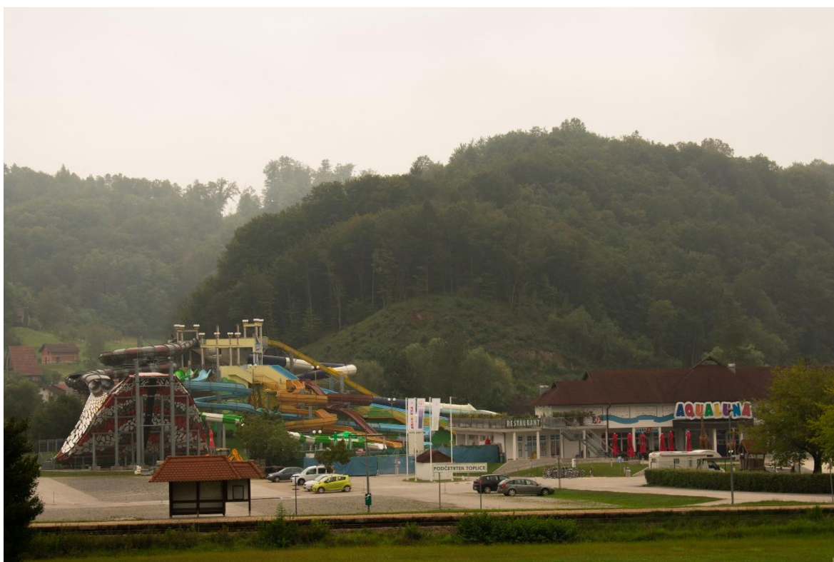
Sl. 10. Termalni park „Aqualuna“, „Terme Olimia“

Osnovicu kupališno-zabavnih sadržaja „Terme Olimia“ čini „Aqualuna“ s 3 000 m 2 vodenih površina. „Aqualuna“ je prikazana na slici 10. Termalni park je u potpunosti ispunjen termalnom vodom. Sastoji se od bazena za opuštanje koji nudi masažu, gejzire i vodeni slap, bazena s valovima, bazena za slijetanje s 9 tobogana, a dio za djecu naziva se „Aqua Jungle“. Tobogani su namijenjeni svim uzrastima, postoje oni za djecu, ali i oni za odrasle željne adrenalina. Ponudu čini ukupno 14 tobogana i vodenih staza. Dio kupališno-zabavnih sadržaja čini i ponuda Family wellness „Termalija“. „Termalija“ ima dio koji se zove „Oaza bazena“ i obuhvaća 2 000 m 2 vodenih površina raspoređenih u nekoliko bazena. Veliki bazen temperature 30 do 32 °C je djelomično unutarnji, a djelomično vanjski te sadrži masaže, rimske kupke, gejzire i slapove. Bazen „Aqua“ pod šatorom temperature 28 do 30 °C nudi vodene mlaznice, zatvoreni tobogan, a osim njega tu su i 2 dječja bazena (unutarnji i vanjski) temperature 32 do 36 °C te 3 whirpoola s temperaturom vode 34 do 36 °C (33).