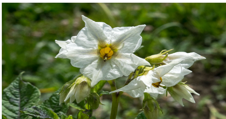
Slika 3.3: Solanum tuberosum

Krumpir (lat. Solanum tuberosum ) je trajna biljka iz porodice pomoćnica. Uzgaja se na svim kontinentima te je s približno 18 milijuna hektara površine, četvrta kultura u svijetu.