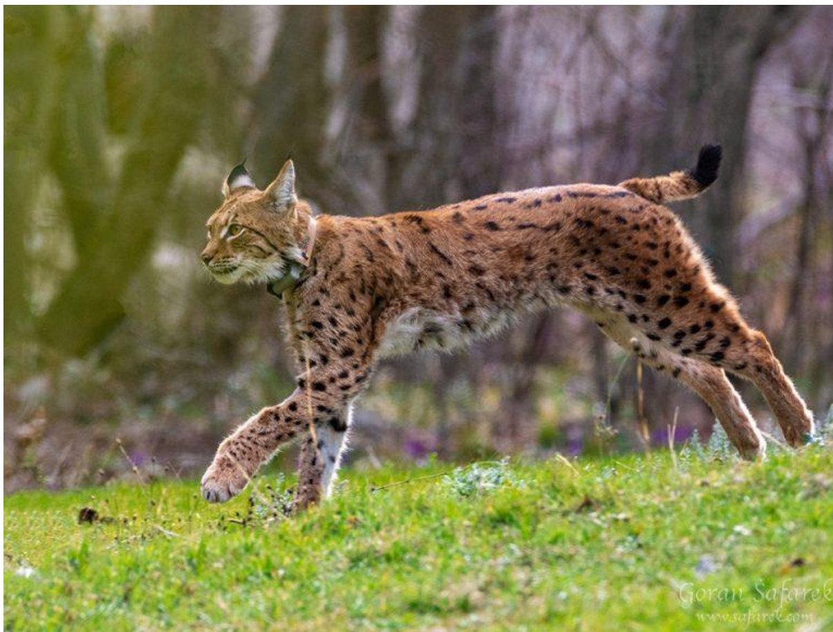
Slika 1: Izgled euroazijskog risa