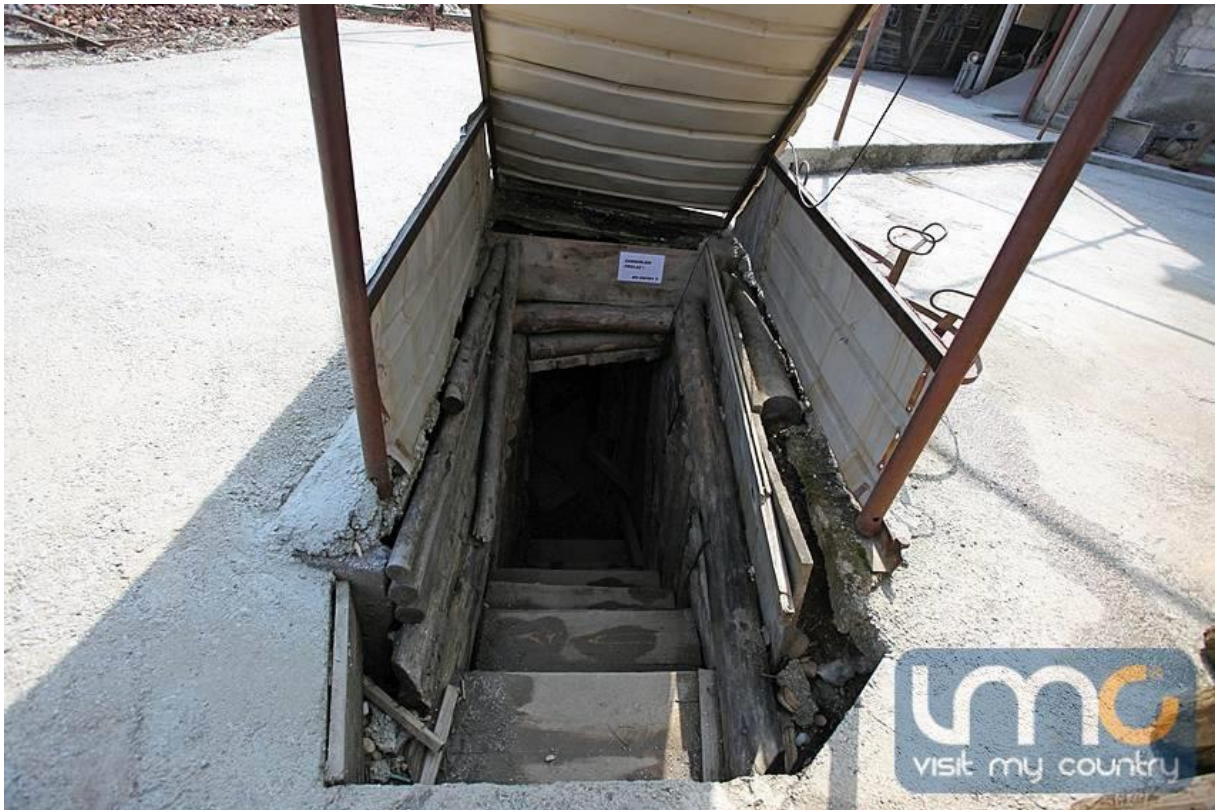
Slika 2. Tunel Dobrinja - Butmir