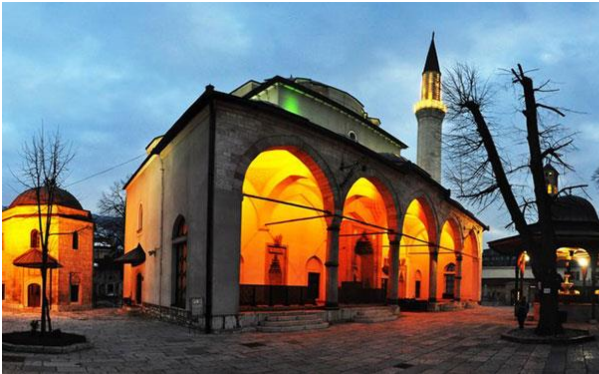
Slika 1. Gazi Huser-begova džamija