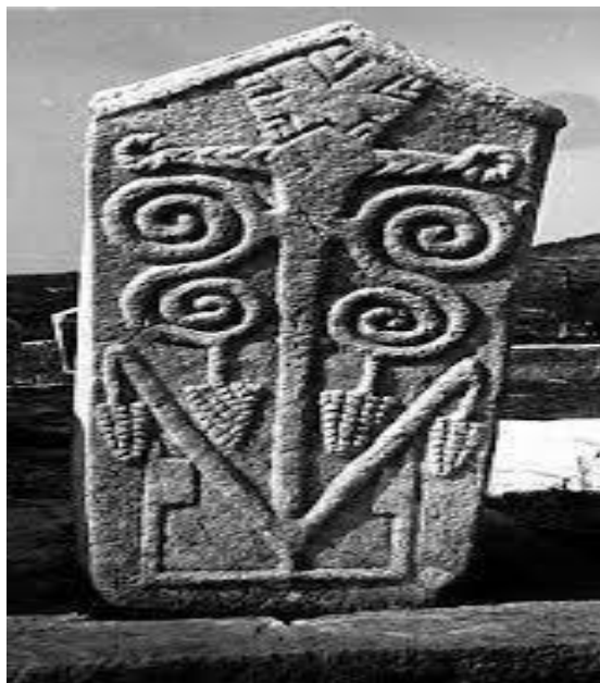
Sl. 6. Stećak "Vitko" Široki Brijeg

Stojeći stećci su najviše klesani u obliku stupova, zapravo stupovi nisu ništa drugo nego uspravni sanduci ili ploče. Kako bi oni čvrsto stajali morali su ih ukopavati u zemlju, pa se tako negdje zovu i „ Usađenici “. Neki stubovi imaju ravnu površinu pri vrhu, dok neki imaju krov na dvije ili tri vode. Također, postoje i oni koji izgledaju bačvasto, zaobljeno ili su udubljeni. Najveći broj stubova je uklesan tako da je donji dio uži nego gornji dio, odnosno oni pri vrhu se postepeno šire. Broj stupova u Bosni i Hercegovini nije baš velik, odnosno obuhvaćaju 4 % od ukupnog broja. (Bešlagić, 2004).