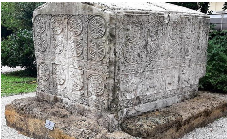
Sl. 5. primjer Zgroščanskog stećka