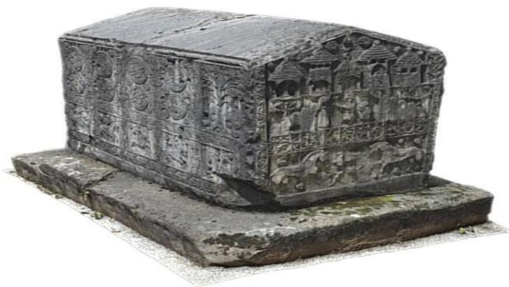
Sl. 1. Primjer stećka iz Zgošće (Kakanj) iz 15. st.

Mnoga interesiranja za njih su započela još prije 450 godina kada je Benedikt Kuriprešić objavio svoj rad” Putopis kroz Bosnu, Srbiju, Bugarsku i Rumeliju 1530 godine.” (Trako, 2011).