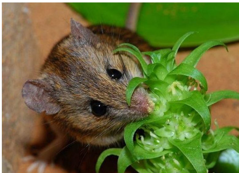
Slika 8. Cvjetovi Whitehedia bifolia oprašivani mišem Aethomys namaquensis ( https://blog.umd.edu/agronomynews/2021/05/ , 9.9.2024.)