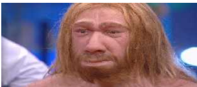
Slika 1. Odrasli neandertalac

Prvu monografiju koja detaljno opisuje anatomiju neandertalca izdao je Dragutin Gorjanovi Kramberger opisujući i nalaze iz Krapine, no ti ostaci su fragmentirani, pa je u javnosti već u popularnost potigla monografija koju je napisao M. Boule opisujući i jedan cjeloviti kostur odraslog muškarca iz La Chapelle-aux-Saints u Francuskoj (slika 2).