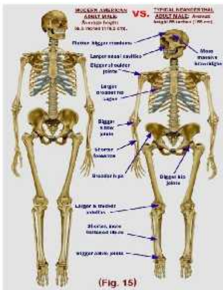
Slika 10. Usporedba anatomske građe neandertalca i modernog čovjeka

Veliki dio osobina neandertalaca naslijeđen je od predaka. Neke su rezultat prilagodbe na okoliš, a neke na način života.