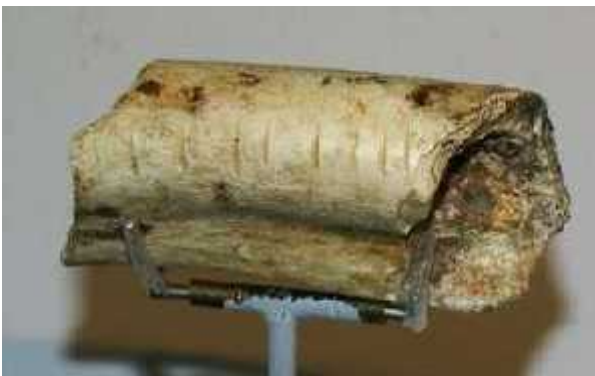
Slika 14. Polomljena neandertalska kost, Musee National de Prehistoire, Les Eyzies, Francuska

Kod rasprave o Neandercima, često se postavlja i pitanje kanibalizma. Na mnogim nalazištima, uključujući i Krapinu, pronađene su polomljene kosti, vjerovatno kako bi se došlo do srži, te polomljene lubanje, kako bi se moglo doći i do mozga (slika 14). To bi mogla biti posljedica geoloških procesa tijekom fosilizacije, a moglo bi i označavati kanibalizam kod neandertalaca. Na kanibalizam upućuje to što su na istim nalazima neandertalci lomili kosti životinja koje su koristili za jelo. Iako je kanibalizam gotovo potvrđen, upitno je je li on bio uzrokovan stresnim situacijama, kao velikom nestašicom hrane u hladnim razdobljima, ili je bio odraz duhovnosti i imao religijsko značenje. Također je upitno jesu li neandertalci jeli članove svoje zajednice ili su bili žrtva drugih zajednica.