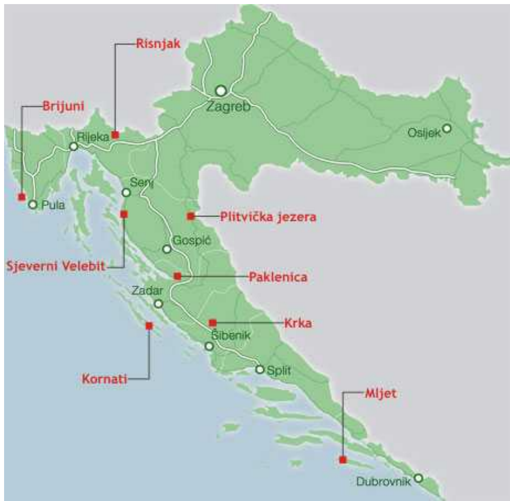
Slika 1. Geografski položaj nacionalnih parkova u Republici Hrvatskoj ( www.camping.hr/hr/hrvatska/nacionalni-parkovi )

NP Sjeverni Velebit najve im je dijelom prekriven šumama, a osim šuma ovdje nalazimo i travnjake, stijene, kamenite vrhove, dok cjelokupno podru je sadrži mnoštvo krških oblika na površini i u podzemlju. Upravo takva raznolikost staništa utje e na raznolikost biljnog i životinjskog svijeta. Unutar Parka nalazi se i strogi rezervat Hajdu ki i Rožanski kukovi, te mnoštvo speleoloških objekata i planinarskih staza (Brali , 2005).