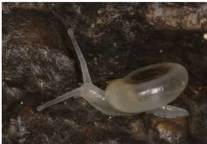
Slika 5. Vrsta Meledella weneri

Prema IUCN ova vrsta danas pripada kategoriji osjetljivih vrsta (VU) zbog direktnih prijetnji. Naime, vrsta je zbog svoje vrlo uske rasporstranjenosti i rijetkih nalaza zanimjiva kolekcionarima što može bitno utjecati na njezin opstanak, kako populacije tako i vrste. Ako se takve radnje nastave, ova vrsta bi u skoroj budućnosti mogla prijeći i u kategoriju ugrožene vrste (EN), posebice zbog osjetljivosti staništa na kojem obitava. Takva podzemna špiljska staništa osjetljiva su na svaki dugoročan utjecaj kao što je odlaganje otpada direktno u staništa ili fizičko uništavanje zbog građevinskih zahvata (Ozimec i sur., 2009).