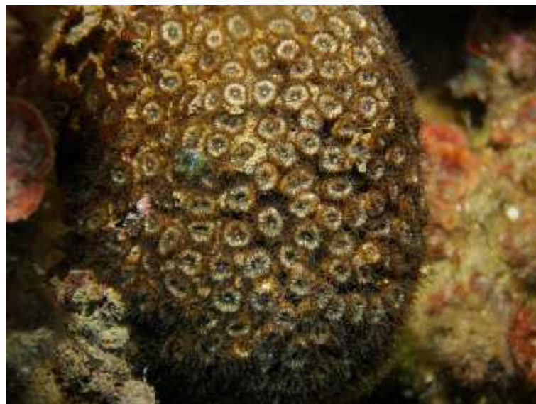
Slika 3. Vrsta Cladocora caespitosa

Kao i većina koralja ova vrsta ugrožena je zbog antropogenog onečišćenja teškim metalima ili prevelikom sedimentacijom koja im smeta. Jedan od novijih problema je i izbjeljivanje polipa zbog gubitka simbiotskih algi zooksantela uslijed globalnog zagrijavanja mora te se tako smanjuje brzina rasta koralja. Alge osim boje koralju daju kisik i fotosintetske proizvode koji mu služe kao hrana te vrše ulogu izlučivanja otpadnih tvari koje su produkt metabolizma koralja. Rizik od izumiranja je za ovu vrstu uvelike povećan neprestanim sakupljanjem zbog suvenira te već spomenutim korištenjem različitih ribarskih alata čime se fizički uništavaju kolonije koralja (Kružić, 2007).