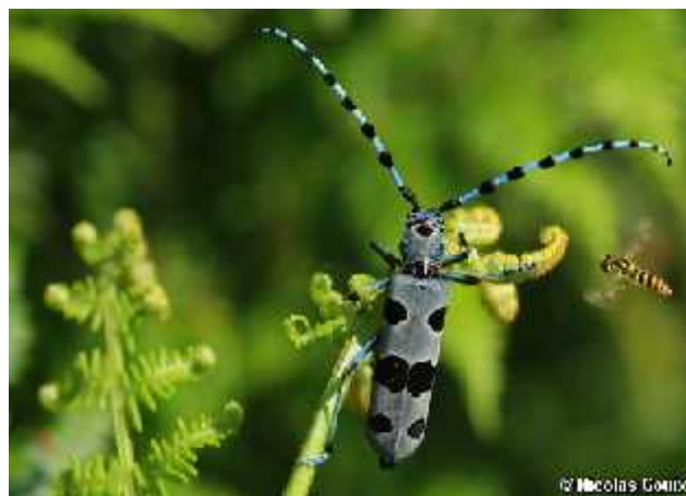
Slika 11. Vrsta Rosalia alpina

Ova vrsta bila je rasprostranjena diljem Sredozemlja i nizinskih šumovitih područja Europe, a danas se zbog antropogenog utjecaja i uništavanja šuma nalazi samo u višim predjelima pa je zbog toga dobila ime R. alpina . Pogrešno se smatra da je njezino stanište vezano samo uz gorski ili planinski pojas, iako to prije nije bio slučaj ( www.dzpz.hr ). Uništavanje šuma najveći je razlog ugroženosti ove vrste. Osim što se nekontrolirano iskorištavaju, iz šuma se uklanja i uništava trulo, umiruće drveće, panjevi i srušena stabla kojima obiluju sve šume u prirodnim uvjetima. Posebice se uništavaju stabla u kojima žive različite vrste saproksilnih kukaca kako dalje nebi oštećivali drveće jer se njih smatra štetnicima. Zbog različitih pogleda na šumski ekosustav biolozi i ekolozi često dolaze u sukobe sa šumarima i šumoposjednicima zbog gore navedenih razloga.