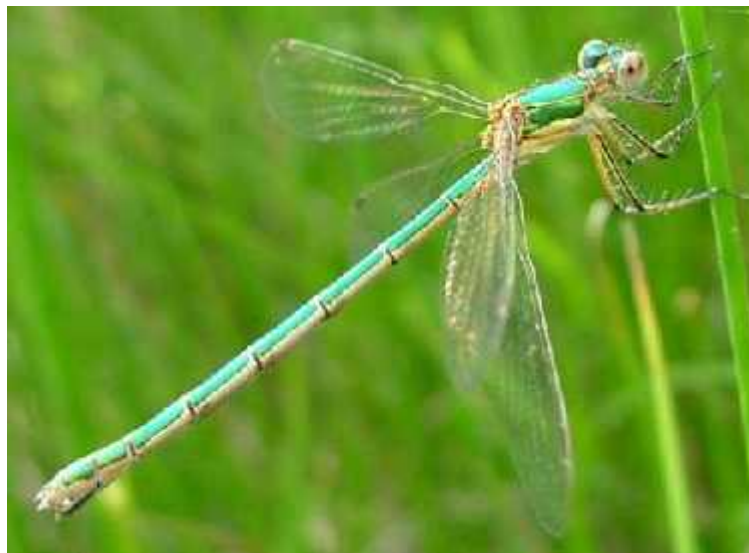
Slika 10. Vrsta Lestes virens

Ova vrsta postala je ugrožena uslijed nestajanja prirodnih staništa, a najviše zbog isušivanja lokvi uz koje obitavaju zbog čega danas imamo malobrojne i to često raspršene populacije. U krškim područjima su vodeni okoliši još više ugroženi jer vode imaju malu mogućnost pročišćavanja pa je svako oneišenje velika prijetnja živom svijetu koji je povezan s njom. Oneišenje podzemne vode na mjestu poniranja može dovesti do oneišenja izvora čime se dalje utječe na vodena staništa uz koja žive veretnca poput vrste L. virens (Belančić i sur., 2008).