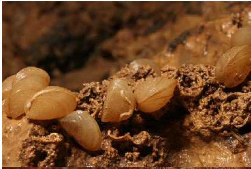
Slika 6. Vrsta Congeria kusceri u Markovom ponoru

Dinarski špiljski školjkaši najviše su ugroženi intenzivnom urbanizacijom u neposrednoj blizini staništa koje uzrokuje zatrpavanje speleoloških objekata te one isušuju podzemnih voda krutim otpadom i otpadnim vodama iz industrija i doma instava. Izravno su ugroženi smanjenjem kvalitete podzemne vode te promjenom režima vode. Također, postoji velik rizik od nestajanja na prirodnom staništu. U neposrednoj blizini Markovog ponora izgrađena je hidroelektrana Senj. Gradnja bilo kakvih hidrotehničkih zahvata dovodi do promjena u kvaliteti i razini podzemnih voda te smanjenja populacije ili njenog nepovratnog oštećenja (Bedek i sur., 2009).