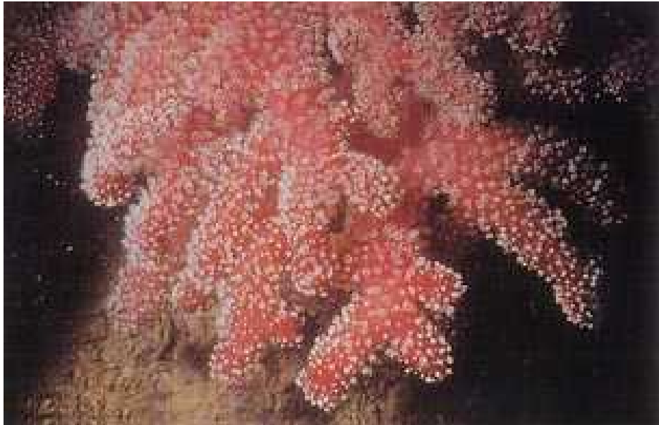
Slika 2. Vrsta Alcyonium palmatum

Koralji, pa tako i vrsta A. palmatum , ugroženi su zbog upotrebe pridnenih mreža i ribarskih alata kojima se uništavaju kolonije koralja jer ih se upa direktno s morskog dna. Ilegalno upanje i uništavanje koralja te ronilački turizam također ugrožavaju ovu vrstu. Osim fizičkih oštećenja, jako teško podnose onečišćenja morske vode zbog eutrofikacije, otpadnih voda i teških metala koji dolaze s obalnog područja (Kruži, 2007).