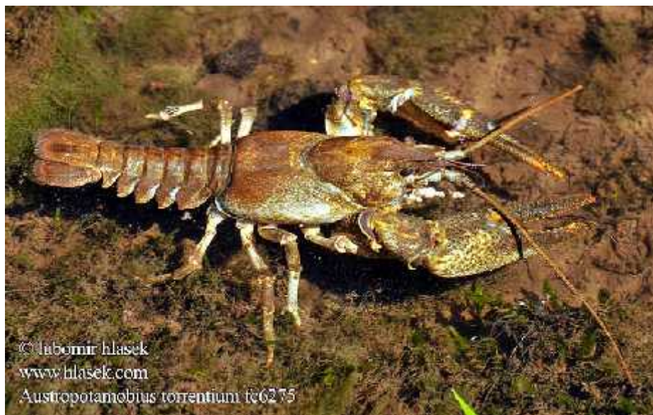
Slika 8. Vrsta Austropotamobius torrentium

Poto ni rak kopa jazbine u obalama vodotokova, a skrovište nalazi pod potopljenim korijenjem ili kamenjem, gdje se no u hrani razli itim vrstama biljaka i otpalim liš em dok se juvenilni rakovi hrane manjim vodenim beskralješnjacima. Poto ni rak nastanjuje brze tokove hladnih potoka s kamenim dnom na višim nadmorskim visinama, iako neki žive i u ve im jezerima i rijekama kao autohtone vrste. U Hrvatskoj se javlja u rijekama savskog slijeva, a prisutan je i u rijeci Zrmanji i Krki te njihovim pritocima. Kao i kod rije nog raka, poto ni rakovi ugroženi su zbog antropogenog utjecaja na vodotokove i unosa alohtonih vrsta. Posebno su osjetljivi na pojavu ve ih koli ina otpadnih tvari u vodi koje negativno utje u na njihov razvoj i razmnožavanje ( www.dzpz.hr ).