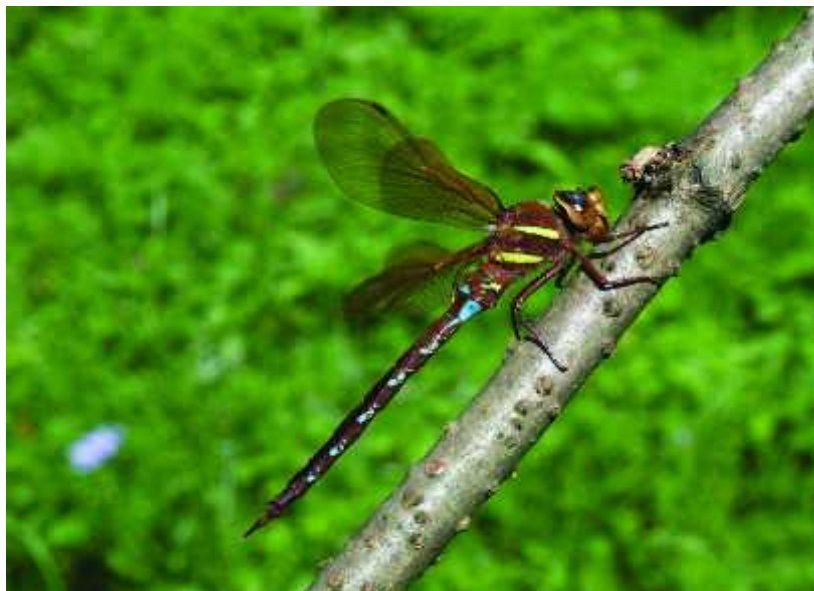
Slika 9. Vrsta Aeshna grandis

Ova vrsta naj eš e se nalazi u šumskim podru jima s postoje im slatkim vodama, kanalima, rukavcima, šumskim jezerima i lokvama s bogatom obalnom vegetacijom. Budu i da je vodeni medij najvažniji dio njihovog života, promjene u vodenim ekosustavima dovode do ugrožavanja ovakvih osjetljivih vrsta. Vrsta A. grandis ugrožena je nestankom i smanjenjem staništa. Vodena staništa se isušuju i pretvaraju u melioracijska podru ja gdje se koriste pesticidi koji dalje one i š uju okolne staja e i podzemne vode. Osim toga problem je i stalna pojava eutrofikacije uslijed stalnog pove anja koncentracije fosfata i nitrata u vodenim staništima. Pretpostavlja se da je najve i uzrok ugroženosti ove vrste (EN) nestanak i uklanjanje vodene i obalne vegetacije, kao i sje a šuma, što vrlo negativno utje e na ovu vrstu koja ionako teško pronalazi staništa koja su idealan spoj istog kopnenog i vodenog ekosustava ( www.dzpz.hr ).