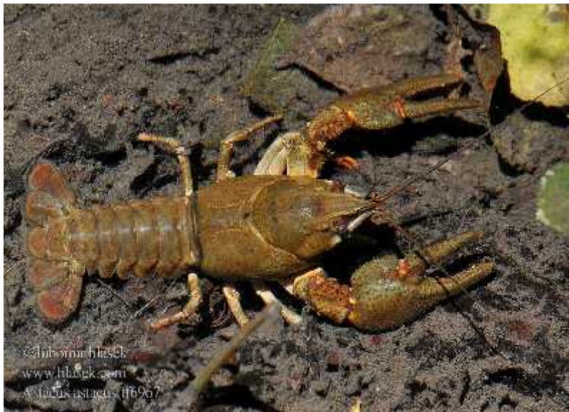
Slika 7. Vrsta Astacus astacus

Rije ni rakovi su svejedi koji se hrane vodenom vegetacijom, beskralješnjacima i detritusom te su zbog toga esto klju ni organizmi vodotokova u kojima žive. Oni su no ne životinje koje žive u istim vodotocima uz obale gdje se nalazi vodena vegetacija, naj eš e su to rijeke i jezera, zbog ega su i nastanili pritoke i vode NP Plitvi ka jezera. Ova autohtona europska vrsta obitava u rijeci Savi i Dravi i njihovim pritocima, a unesena je i u pojedine rijeke jadranskog slijeva ( www.dzzp.hr ). Ugroženi su ponajviše zbog regulacije vodenih tokova, prekomjernog izlova i unosa alohtonih vrsta poput ameri kih vrsta rakova. Invazivne vrste rakova donose sa sobom bolesti na koje autohtoni rije i rakovi nisu otporni, a mogu uzrokovati i njihovo istiskivanje iz prirodnog staništa zbog borbe za hranu i prostor.