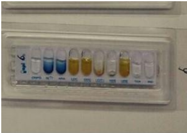
Slika 1. Izgled pozitivnog Api testa za P. aeruginosa .

Za potvrdu sojeva smo koristili test na citokrom oksidazu te komercijalni biokemijski niz API 20E/NF (Slika 1). Citokrom oksidaza testom smo dokazivali proizvodnju enzima citokrom C oksidaze. Taj enzim, ukoliko je prisutan u ispitivanoj bakterijskom kulturi, u prisutnosti atmosferskog kisika katalizira oksidaciju fenilendiamina iz testa do tamnoljubičaste komponente indofenola (Stilinović i Hrenović, 2009). Test se izvodio na način da se malo bakterijske kulture mikrobiološkom ušicom nanijelo na disk natopljen sa dimetil p-fenilen diaminom. Pojava ljubičaste boje se smatrala pozitivnom reakcijom. API komercijalni test sadrži niz supstrata za određivanje biokemijskih reakcija te daje odgovor o kojoj je bakteriji riječ. API test se izvodio prema uputama proizvođača. Uzorkom bakterijske kulture su napunjene jažice sa supstratima te je test inkubiran 24 h na 37 °C, u vlažnom okolišu. Vlažan okoliš je postignut tako što su okolne jažice bile prelivene fiziološkom otopinom. Prema boji reakcija smo očitali rezultate te prema njima, u predviđenom komercijalnom programu (Apiweb, BioMerieux) pronašli o kojoj se bakteriji radi. Za pokus smo odabrali 10 različitih sojeva P. aeruginosa koji su potvrđeni API testom i testom na citokrom oksidazu, a izdvojeni su iz različitih uzoraka vode.