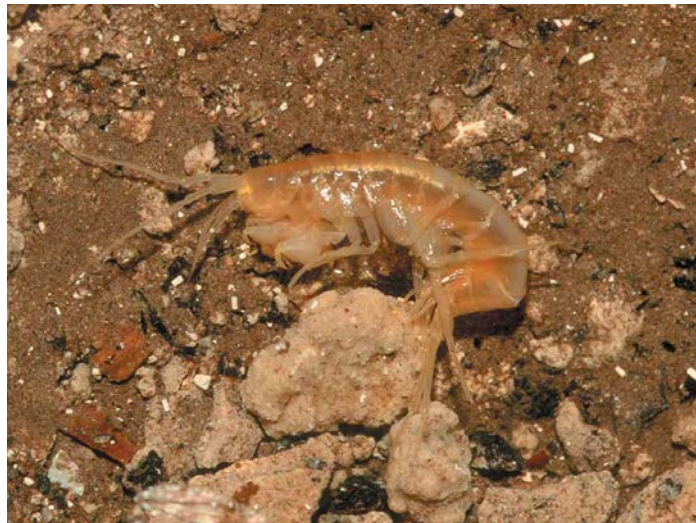
Slika 3. Endemična vrsta Niphargus miljeticus Straškraba, 1959, špilja Ostaševica, otok Mljet

Tipiska Niphargus s. steueri Schellenberg, 1935 na području Istarskog poluotoka, N. s. subtypicus Sket, 1960 u jugoistočnoj Sloveniji i sjeverozapadnoj Hrvatskoj, N. s. liburnicus Karaman, G. & Sket, 1989 na području otoka Krka i na području Gorizia u Italiji. Podvrsta N. s. kolombatovici se rasprostire najjugoistočnije te ima najveći areal rasprostranjenosti od svih podvrsta vrste N. steueri (Fišer i sur., 2006).