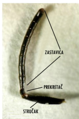
Slika 3. Građa ticala

( http://www.blog.dnevnik.hr/apikultura/osjetni_sustav.html )