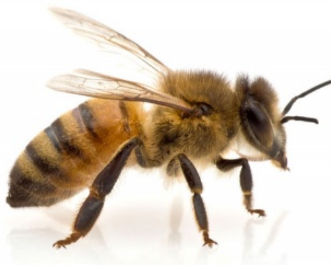
Slika 1. Najpoznatija vrsta roda Apis : Apis mellifera .

Tema ovog rada proučava načine komunikacije i orijentacije kod potporodice Apinae, roda Apis . Unutar roda Apis razlikuje se više vrsta (species), podvrsta (subspecies) i varijeteta (varietates). Prema podacima iz Resh i Cardé (2003) rod Apis L. obuhvaća 11 vrsta među kojima su najpoznatije: Apis mellifera (pčela medarica, sl. 1.), A. dorsata (divovska indijska pčela), A. florea (sitna indijska pčela) i A. cerana (indijska pčela).