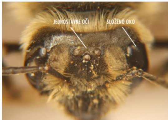
Slika 2. Optička osjetila pčele – izgled i položaj jednostavnih i složenih očiju.

ultraljubičastu, modru i modrozelenu, dok crvenu ne vide tj. vide je kao tamnosivu do crnu. Za pčele je važno da vide ultraljubičasti dio spektra jer gotovo jedna četvrtina cvjetova reflektira ultraljubičaste zrake (detaljnije u poglavlju 5. Orijentacija pčela). Također, dobro razlikuju oblike pojedinih predmeta i pojedinih cvjetova.