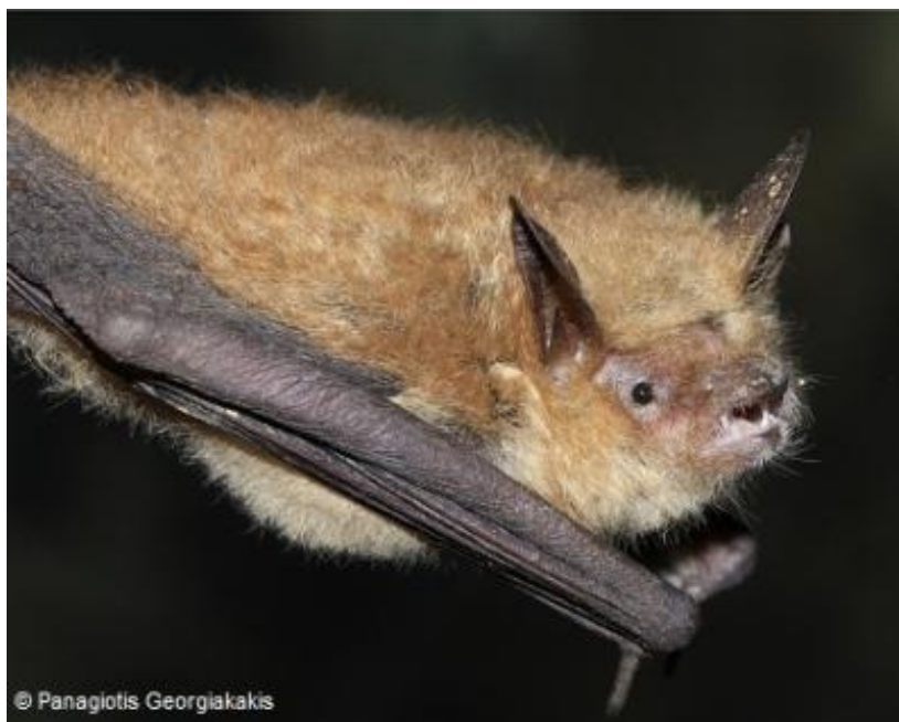
Slika 4.3.1 - Myotis emarginatus

On je globalno ugrožena vrsta. Pretpostavlja se da je ugroženosti doprinijela pojačana upotreba pesticida, te uništavanje i uznemiravanje kolonija. U panonskom dijelu areala ugrožen je i zbog impregnacije drvene građe za krovove tvarima otrovnim za toplokrvne životinje (Mrakovčić i sur, 2008).