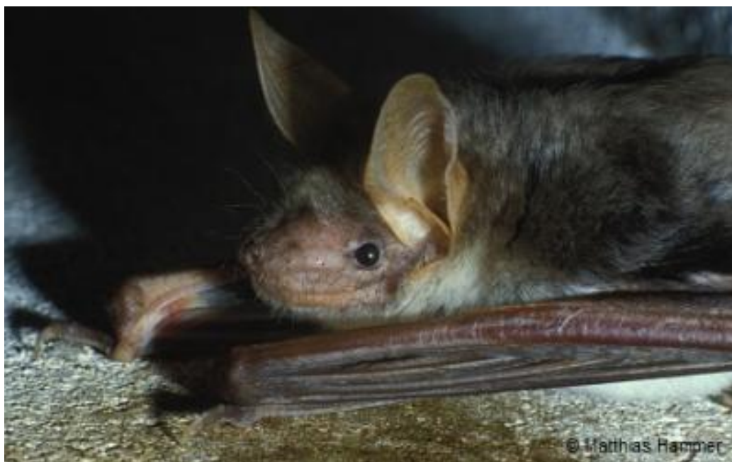
Slika 4.2.1 - Myotis blythii ( www.eurobats.org )

Živi u podzemnim skloništima i napuštenim kućama. U ljetnim skloništima često dolazi zajedno s dugokrilim pršnjakom ( Miniopterus schreibersii ), velikim šišmišom ( Myotis myotis ) i vrstama roda Rhinolophus ( Rhinolophus sp. ). Porodijske kolonije mogu imati preko 5 000 jedinki. Počinju se pariti u kolovozu. Uglavnom su stacionarna vrsta čija su ljetna i zimska prebivališta udaljena oko 15 km. Lovni u krugu 25 km od prebivališta a hrani se insektima. U nas je prilično česta vrsta, pa je njezin status očuvanosti prema IUCN-u 'najmanje zabrinjavajući'. Iako nije uvrštena na popis ugroženih vrsta šišmiša u Republici Hrvatskoj, mogući razlozi njene ugroženosti u budućnosti mogu biti trovanje drva u potkrovljima zgrada insekticidima, uznemirivanje porodijskih kolonija i kolonija na zimovanju. (Antonić i sur., 2015)