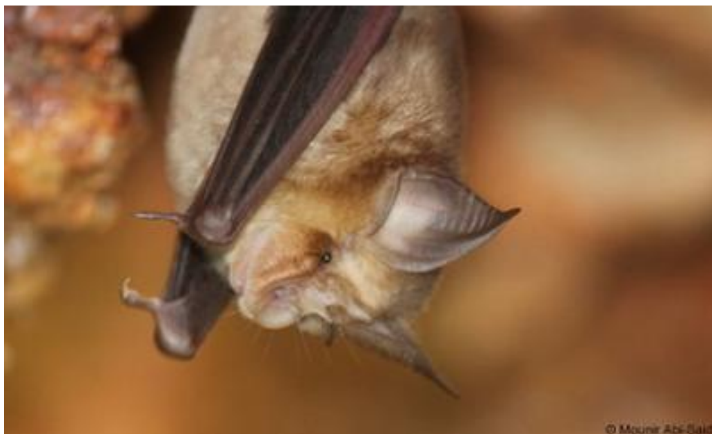
Slika 4.4.1 - Rhinolophus blasii

Krzno mu je mekano, na leđima sivo-smeđe a na trbuhu gotovo bijele boje. Pare se jednom godišnje - u jesen prije hibernacije. Zimuje uglavnom od listopada do ožujka. U proljeće ženka koti jedno mlado. Ovisno o temperaturi okoliša, mlado nosi od 7 do 10 tjedana. Hrani se paucima, noćnim leptirima, mušicama, moljcima i ostalim sitnim kukcima (D. Marguš). Lovi na visini od jednog do pet metara leteći između vegetacije. Ugrožen je promjenom i gubitkom staništa, uznemiravanjem porodiljskih kolonija te upotrebom pesticida.