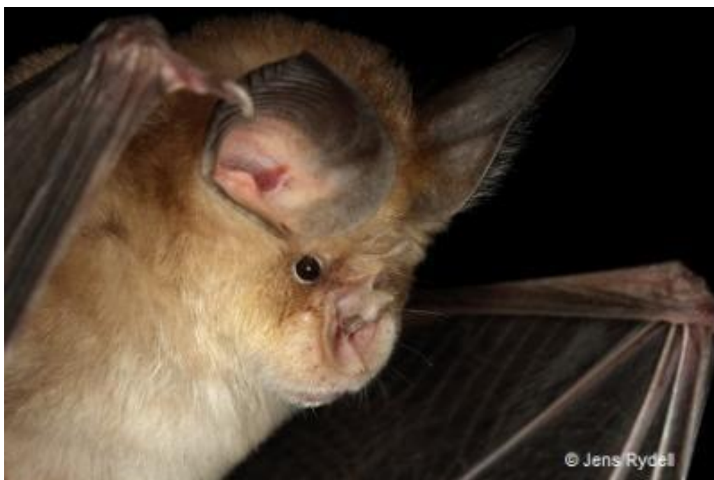
Slika 4.5.1 - Rhinolophus euryale

Lovno stanište su mu livade s grmljem, a lovi noćne leptire i ostale kukce. Ljeti često tvori zajedničke kolonije s velikim potkovnjakom ( Rhinolophus ferrumequinum ), riđim šišmišem ( Myotis emarginatus ) i dugokrilim pršnjakom ( Miniopterus schreibersii ). Zimske kolonije su samostalne, ili s velikim potkovnjakom, no u Hrvatskoj do sada nije pronađena veća zimujuća kolonija. U primorju je često aktivan i zimi. Živi prosječno 13 godina. Također je globalno ugrožena vrsta, a razlozi ugroženosti su uznemiravanje prstenovanjem, speleološki posjeti i uporaba pesticida.