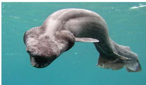
Sl. 4. Chlamydoselachus anguineus