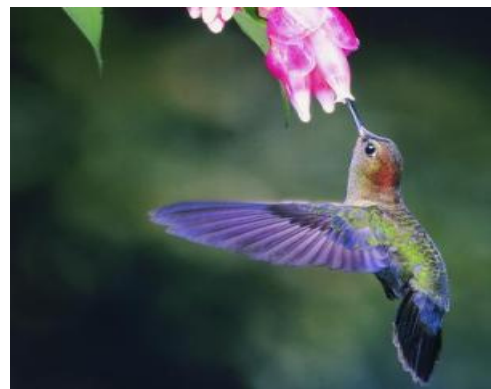
Sl. 11. Kolibrić u letu

Kao i za mnoge druge žive fosile i za kolibriće( Sl. 11 ) se isprva smatralo da su se razvili relativno nedavno jer su najstariji pronađeni fosili stari 1 do 2 milijuna godina bili iz Novog svijeta, sve dok 2004. godine iskapanje u Njemačkoj ( Perkins, 2004) nije donijelo dva nova fosila za koje se ispostavilo da potječu iz Starog svijeta i stari su između 30 i 34 milijuna godina. Ta je činjenica ovim malim pticama zaradila titulu živih fosila..Iako ih ima preko 300 živućih vrsta, nalazimo ih samo na području američkog kontinenta.