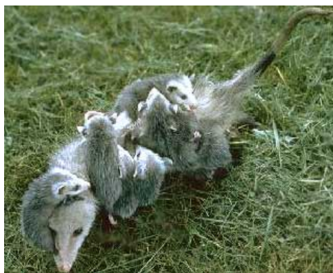
Sl.16.Ženka sjevernoameričke naboruše sa mladuncima

Svejed je, dobro se penje, pliva i snalazi na tlu. Kada je u opasnosti, pretvara se da je mrtav-nepomično leži otvorenih usta iz kojih viri jezik i otvorenih očiju i iz izmetnog otvora ispušta smrdljivu tekućinu.