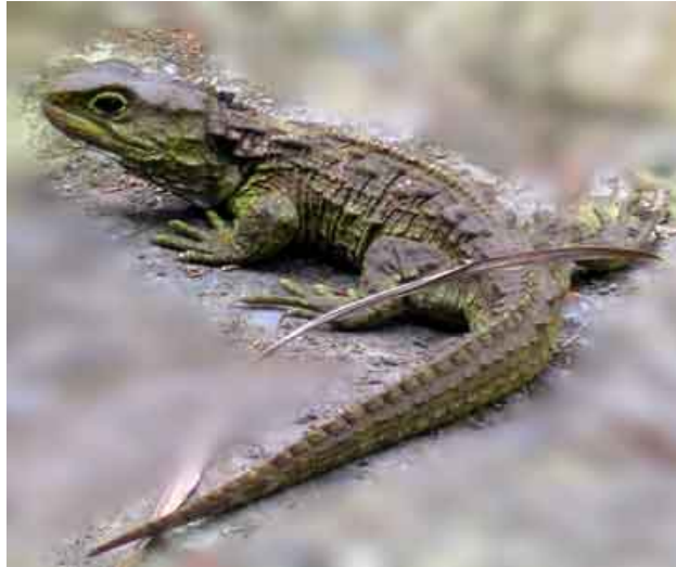
Sl. 7. Pilasti premosnik (tuatara)