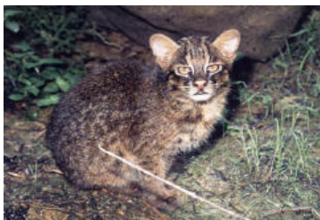
Sl. 18. Iriomote cat ili japanska mačka