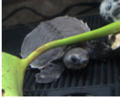
Sl. 9. Australoazijska pig-nose kornjača