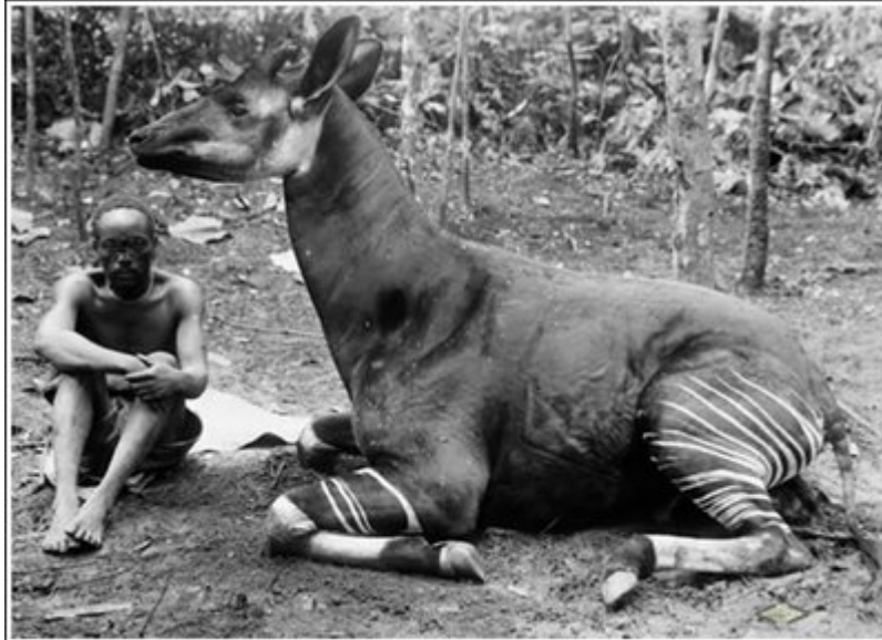
Sl.12. Okapi,uočljive primitivne pruge na sve četiri noge