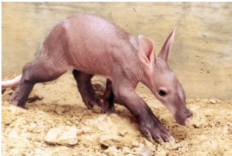
Sl. 14. Mladunče aardvarka

Aardvark je životinja prilično slična svinji. Tijelo im je lagano zakrivljeno u leđima i rijetko pokriveno oštrom čekinjastom dlakom. Stražnja stopala imaju po 5 prstiju, a prednja stopala završavaju sa 4 prsta od kojih svaki nosi veliki, robustan nokat u obliku lopatice, za koji se vjeruje da predstavlja prijelazni oblik između pandže i kopita. Izdužena glava smještena na kratkom vratu drži disproporcionalne uši i mala tubularna usta specifična za životinje koje se hrane termitima. Može narasti do maksimalne dužine od 2,2 metra. Kao primarna obrana mu služi debela koža.