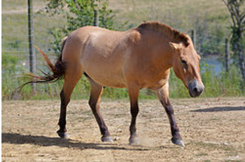
Sl. 17. Mongolski divlji konj

kromosoma(najvjerojatnije povećanja) došlo relativno nedavno( Ishida i sur. 1995 ). Ima 66 kromosoma dok domaći ima 64. Mogu se međusobno pariti i producirati fertile potomke sa 65 kromosoma.