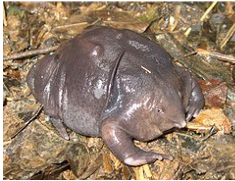
Sl. 6. Ljubičasta žaba za vrijeme monsuna

Kad se uzmu u obzir njena izrazito izbočena njuška i malena ventralno smještena usta, vrlo je vjerojatno da se radi o vrsti specijaliziranoj za termite kojima se hrani isključivo pod zemljom (Dutta et al. 2004; Radhakrishnan et al. 2007).