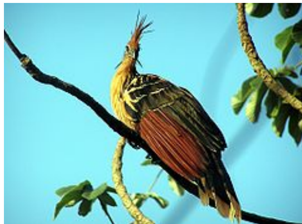
Sl. 10. Ciganska kukmača, odrasla jedinka

Neobična vrsta tropske ptice ( Sl. 10 )nađena je u močvarama, kišnim šumama i mangrovama Amazone i delte rijeke Orinoco u Južnoj Americi. Jedini je član roda Opisthocomus (na drevnom grčkom to znači nositi dugu kosu unatrag, misli se na njezinu dugu krijestu).