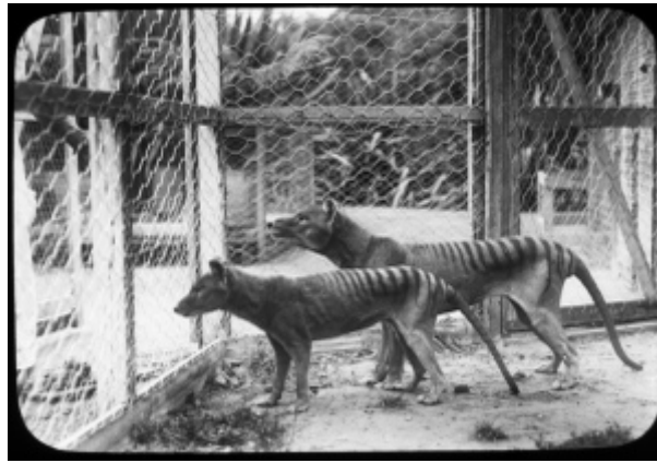
Sl. 19. Posljednji živi primjerci u zatočeništvu prije nego su izumrli 1936.g.