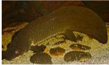
Sl. 2. Neoceratodus forsteri

trihotomiju između ove 3 grupe. Ipak, znanstvenici su na temelju otkrića ovih vizualnih pigmenata smještenim u čunjićima vrste N. Forsteri zaključili da su prvi kopneni kralježnjaci ukoliko im dvodihalice jesu najbliži živući srodnici, mogli imati vizualna osjetila osjetljiva na boje, što je izuzetno važno s obzirom na to da se perzistentnost, gubitak ili duplikacija gena za opsin reflektira na spektralni okoliš i vizualne potrebe određene vrste.