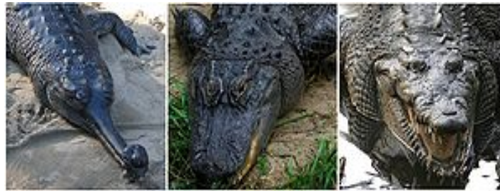
Sl. 8. S lijeva na desno: indijski gavijal ( Gavialis gangeticus ), američki aligator ( Alligator mississippiensis ), američki krokodil ( Crocodylus acutus )

Danas živi krokodili dijele se u tri grupe sa statusom porodica. Pri tom se porodica gavijala sastoji od samo jedne recentne vrste, indijskog gavijala. Crocodylidae, ili pravi krokodili, prepoznatljivi su po udubini u gornjoj čeljusti u koju ulazi četvrti zub donje čeljusti tako da je izvana vidljiv. Kod aligatora (Alligatoridae) se kod zatvorenih čeljusti ne vide zubi, a i njuška im je šira i nešto kraća nego kod krokodila.