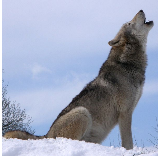
Slika 10. Zavijanje en.wikipedia.org

što onemogućava slušatelju da odredi točan broj članova čopora (Mech, Boitani, 2003). Takvo prikriivanje pravog broja može loše izaći za suparnički čopor ako su krivo procijenili broj. Zavijanje se čuje na udaljenosti od 16 km pri povoljnim vremenskim uvjetima (en.wikipedia.org).