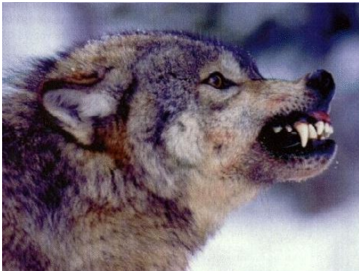
Slika 8. Agresivnost

Uspravne uši i nakostriješeno krzno na leđima su signali ljutnje. Usne se pomaknu prema gore ili nazad da se vide očnjaci. Vuk također može i svinuti leđa u luk i režati (Feldhamer, Thompson, Chapman, 2003).