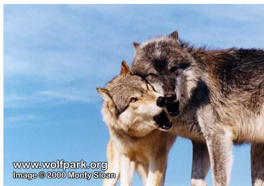
Slika 4. Vučji par

Dominantan par jedini ima potomstvo u čoporu. Par je monogaman, ali ako dođe do smrti alfa jedinke, novi alfa mužjak ili ženka će preuzeti reprodukcijsku ulogu ( www.animaldiversity.ummz.umich.edu ). Vučica se tjera jednom u godini, između siječnja i travnja – u sjevernim dijelovima kasnije, u južnim ranije (Feldhamer, Thompson, Chapman, 2003). Za vrijeme sezone parenja, alfa par postane nježan jedno prema drugome dok čekaju ženski ovulacijski ciklus. U to vrijeme alfa par (sl. 4) ponekad mora spriječiti ostale vukove da se ne pare međusobno. Reprodukcija ženskih vukova se regulira agresivnošću među ženkama, prekidanjem pokušaja kopulacije i odgađanjem reprodukcije mladih ženki (Feldhamer, Thompson, Chapman, 2003).