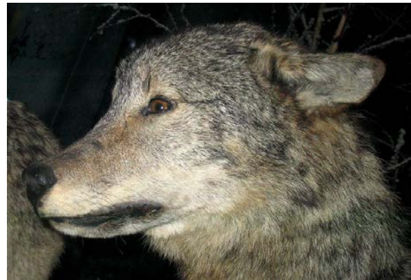
Slika 9. Strah en.wikipedia.org

Uplašen vuk (sl.9) pokušava sebe učiniti što manjim i manje napadnim; uši su polegnute uz glavu, rep može biti između nogu kao i kod podčinjenog vuka. Također može cviliti ili lajati iz straha te svinuti leđa u luk. Agresivan vuk (sl.8) ima nakostriješenu dlaku, reži i u čučnju je spreman napasti ako treba (Mech, Boitani, 2003). Opuštenom vuku rep pokazuje prema zemlji te može mahati njime. Što je rep bliže zemlji to je vuk opušteniji. Vuk odmara u položaju sfinje ili na bočnoj strani. Sreću pokazuje kao i psi, mašući repom, može imati isplažen jezik. Ako je vuk zaigran, drži rep visoko i maše njime, može skakutati okolo ili spustiti prednji dio tijela do zemlje, dok zadnji dio drži visoko u zraku (Mech, Boitani, 2003).