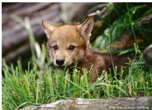
Slika 5. Štene

Kada alfa ženka uđe u estrus, ona i mužjak će provesti neko vrijeme odvojeni od ostatka čopora. Tjeranje traje 5 – 14 dana, za vrijeme kojeg dolazi do parenja ( www.animaldiversity.ummz.umich.edu ). Trudnoća traje 62, 63 dana, a vučići (sl. 5) se rađaju u brlogu koji je vučica prije iskopala (Feldhamer, Thompson, Chapman, 2003). Ako se brlog