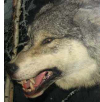
Slika 3. Očnjaci vuka

Vuk se hrani gotovo isključivo mesom, kostima i drugim dijelovima tijela životinja koje lovi, pa mu je i glava građena tako da omogućava hvatanje i jedenje plijena. Glava vuka je izdužena prema naprijed, duga prosječno 25, a široka 14 cm. Volumen mozga je od 150 do 170 cm 3 , što je najmanje 30 cm 3 više nego u većine pasa. Masivne čeljusti daju osnovu za koju su pričvršćeni snažni žvačni mišići i 42 specijalizirana zuba. Očnjaci (sl. 3) su najveći, a služe za hvatanje i ubijanje plijena. Za žvakanje i "rezanje" mesa i tetiva vuk se najviše koristi četvrtim gornjim pretkutnjakom i prvim donjim kutnjakom (karnasijalni zubi), koji pri žvakanju djeluju kao škare, dok mu za lomljenje kostiju služe snažni kutnjaci ( www.life-vuk.hr ). Sva osjetila, a naročito njih i sluh, u vuka su odlično razvijena ( www.life-vuk.hr ).