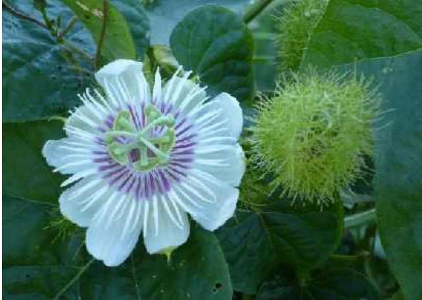
Slika 11. Passiflora foetida , cvijet i ljepljive dlake

korovom. Plod je slatkast, žuto-naranaste boje dok su sjemenke crne boje poredane u sredini ploda. Ptice jedu otpale plodove i time rasprostranjuju biljku ( http://en.wikipedia.org/wiki/Passiflora_foetida ).