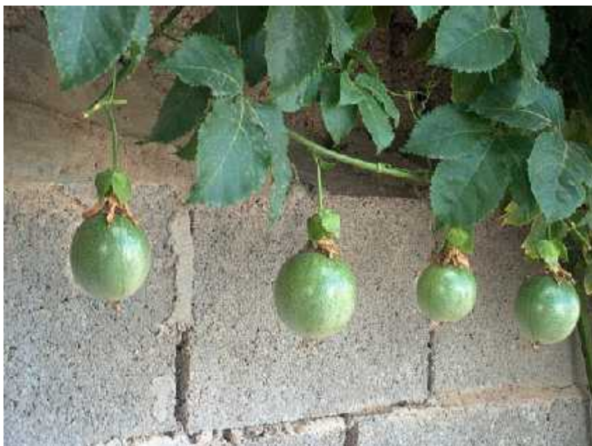
Slika 10. nedozreo plod slatke granadille

Poznata i kao "še erna" granadilla u zemljama španjolskog govornog područja, ova se vrsta koristi i umjesto šeera ili meda u pripremanju slastica. Najviše se uzgaja na plantažama u Australiji, Južnoj Americi te u tropskim planinama Afrike. Pogoduje joj visoka nadmorska visina; 1700 – 2600 m i temperature između 15 - 18°C. Najveći uvoznici ovog aromatičnog voća su Belgija, Nizozemska, Švicarska, Španjolska, SAD i Kanada. Popularnosti ploda doprinijela je činjenica da sadrži vitamine A i C te kalij, fosfor, željezo i kalcij u velikim količinama ( http://en.wikipedia.org/wiki/Passiflora_ligularis ). Cvijet je nježno ljubičaste boje sa ljubičastom koronom, dok su plodovi jarko do blago narančasti (Slika 10.).