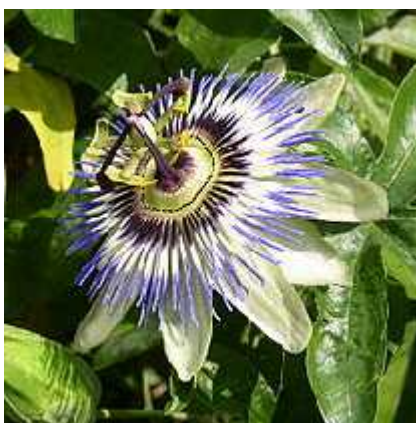
Slika 3. Passiflora caerulea

1975.). Cvjetovi ove vrste su bijeli, ponekad ruži asto prelivekih sa plavom koronom (Slika 3.). Njeni listovi sadrže spoj zvan cijanogenetski glikozid koji je vrlo otrovan te se zbog toga ne koriste za pravljenje ljekovitih pripravaka. Za ljekovite pripravke umjesto listova koriste se vrlo mirisni cvjetovi. Modra pasiflora je esto korištena za stvaranje novih kultivara, i križana uglavnom sa vrstom P. alata Curtis. Njeni plodovi su mali, i jako kiseli pa se naj eš e ne koriste u prehrani. Ova vrsta potje e iz Argentine i Brazila gdje ju nazivaju pasionaria ili mburucuyá ( http://en.wikipedia.org/wiki/Passiflora_caerulea ).