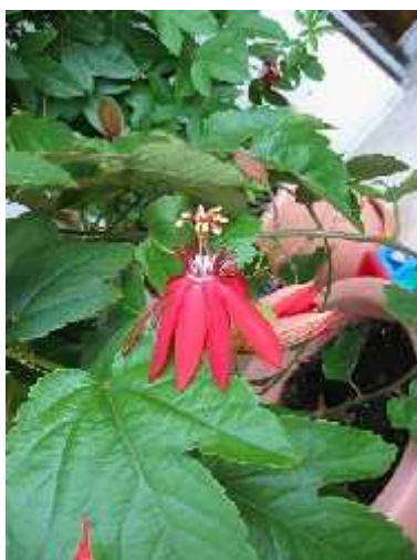
Slika 7. Passiflora vitifolia

Crveni cvjetovi ove vrste, kratkih crveno-žutih korona cvatu od ranog ljeta do jeseni (Slika 7.). Stabljike su joj nježne i prekrivene sme im dlačicama, a listovi trorežnjasti i blistavi. Iako je jedna od najbujnijih i najdulje cvatu ih pasiflora, Passiflora vitifolia ne podnosi niske temperature i mraz. (Gomaz 2007.) Najdraža je hrana raznovrsnim gusjenicama iz roda Heliconius . U borbi protiv gusjenica ovoj vrsti pomažu i simbiotski mravi koji fizički odstranjuju gusjenice sa listova i stabljika (Smiley 1986.).