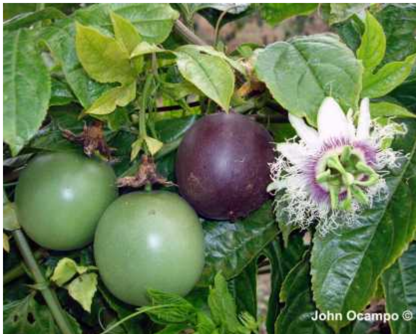
Slika 2. Ljubičasti plodovi vrste Passiflora edulis

Ova vrsta se zbog svojih velikih i jestivih plodova uzgaja na velikim plantažama Indije, Šri Lanke, Novog Zelanda, na Karibima i Haitiju, u Brazilu, Kolumbiji, Ekvadoru, Indoneziji, Peruu, Australiji, Izraelu, južnim dijelovima SAD-a i južnoj Africi. Plodovi se koriste za jelo ili se njegovi sokovi dodaju brojnim voćnim sokovima za pojačanje arome. Postoje dvije vrste plodova koji se intenzivno uzgajaju – žuti i ljubičasti (Slika 2.). U dijelovima središnje i Južne Amerike domoroci motaju osušene listove ove vrste u cigarete ( http://en.wikipedia.org/wiki/Passiflora_edulis ).