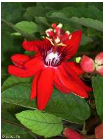
Slika 8. Passiflora coccinea

Leal 2001.). Zbog boje cvjetova ova se vrsta često zamjenjuje vrstom P. vitifolia . Uz još jednu vrstu, jedina je koja ima plodove crvene boje (Horvatović i sur. 2007).