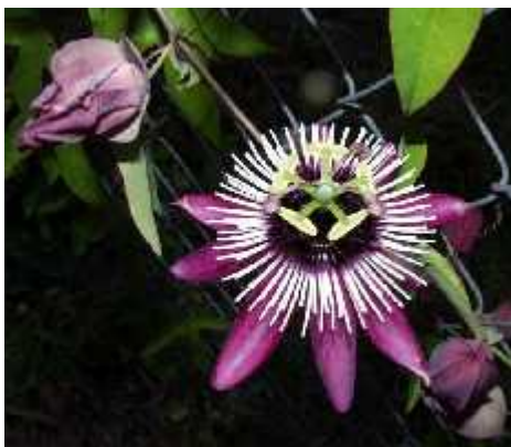
Slika 9. Passiflora x violacea

Passiflora x violacea je ljubiasto-bijele boje te naraste do 3 metra u visinu (Slika 9.). Krošnja joj je široka i do 1,5 metara. Osjetljiva je na niske temperature (do -5^{\circ}\text{C} ) i nametnike (Gomaz 2008). Ova je vrsta jedna od najstarijih i danas najpoznatijih hibrida, križanac vrsta P. caerulea i P. racemosa . Plodovi su vrlo su mali i šuplji, bez soka, a katkad ih uopće nema ( http://coolexotics.com/plant-461-passiflora-x-violacea.html ).