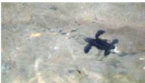
Slika 7... u kojem je našao uto ište!