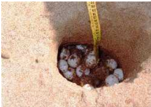
Slika 3. Mjerenje dubine položenih jaja

I zadnje što bih spomenula je injenica da podizanje morske razine, što je posljedica topljenja ledenjaka, utje e na nestanak gnijezdišta jer se smanjuju raspoložive površine plaža.