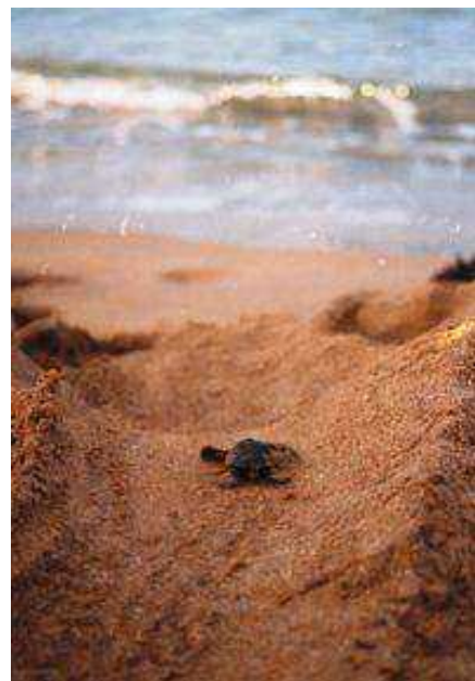
Slika 6. ...prema moru...