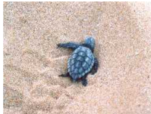
Slika 4. Mlado morske kornja e