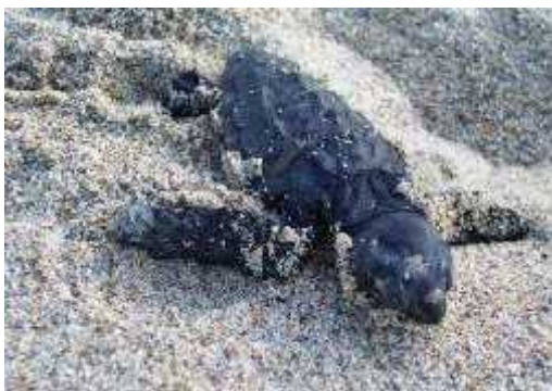
Slika 5. Puzanje mladog od gnijezda...