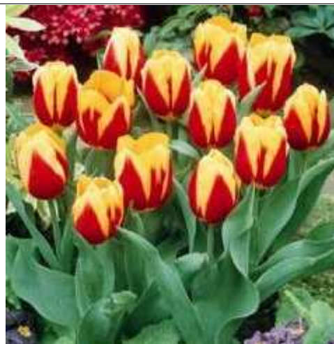
Slika 3. Tip Keizerkroon ( www.vanengelen.com )

Nizozemci su postali vješti uzgajivači tulipana već u vrijeme kad su tulipani izazvali tulipomaniju te skoro uzrokovali krah ekonomije, njihova se strast za ljubljenim im cvijećem nije smanjila do danas. Do vremena kada se više nisu smjeli uzgajati tulipani inficirani virusima zbog činjenice da takve lukovice dovode do degeneracije biljke, uzgajivači tulipana su već savladali tehniku kako hibridizacijom uzgojiti tulipane koji slični su „Rembrandtovim“, a da su pritom bez virusa i genetički stabilni. Tako je crveno-žuti tip „Keizerkroon“ (sl. 3. i 4.) poznat još od 1750. godine. Od tih vremena, uzgajivači hibrida neumorno rade na razvoju novih i ljepših kultivara. Danas su mnogi različiti kultivari dostupni za uzgajanje kod kuće. Nizozemska je pak najveći proizvođač cvijeća na svijetu i izvozi više lukovica tulipana nego ijedna druga zemlja (Pi-Yu, 2007).