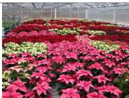
Slika 12. Komercijalni uzgoj zaraženih biljaka