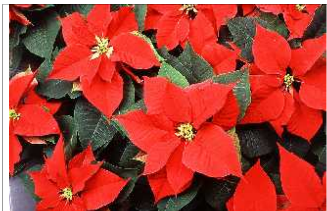
Slika 6. Božićna zvijezda

Biljni rod Euphorbia potječe iz porodice dvosupnica Euphorbiaceae . Rod sadrži oko 2160 vrsta što ga čini jednim od najraznovrsnijih u biljnom carstvu. Euphorbia antiquorum i Euphorbia serrata su predstavnici roda, a opisao ih je Linnaeus 1753. godine u svom djelu »Species Plantarum«. Botaničko ime euforbija dobila po Euphorbusu – omiljenom liječniku numidijskog kralja Jube koji je, prema predaji, prvi upotrijebio otrovan sok božićne zvijezde, i to navodno kao lijek. Carolus Linnaeus nadjenulo je ime Euphorbia cijelom rodu u liječnikovu čast ( en.wikipedia.org/wiki/Euphorbia ). Sve biljke iz porodice Euphorbiaceae ili mlječi sadrže mlječni sok koji istječe iz biljke pri oštećenju ili orezivanju. Sok je otrovan i nadražuje kožu, a treba paziti da ne dođe u dodir s očima. Ako se pojede, djeluje kao purgativ ( hr.wikipedia.org/wiki/Božićna_zvijezda ).