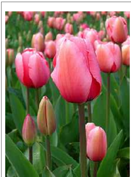
Slika 1. Tulipan ( hr.wikipedia.org/wiki/Tulipan )