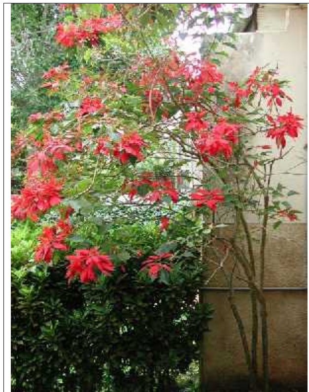
Slika 10. Stablo Boži ne zvijezde

Asteci su ovu biljku kultivirali znatno prije pojave krš anstva na Zapadu. Zvali su je Cuetlaxochitl (Pi-Yu, 2007). Prema meksi koj legendi, ljepotu duguje aste koj boginji kojoj je zbog nesretne ljubavi, prepuklo srce. Iz kapljica njezine krvi izrastao je vatreni cvijet žarkocrvene boje okružen zelenim listovima (hr.wikipedia.org/wiki/ Boži na_zvijezda). Sjajni «cvijet» su starosjedioci kontinenta obožavali i smatrali simbolom isto e. Tako er su obojene listove (brakteje) ove biljke koristili za dobivanje purpurne boje. U 17. stolje u s obzirom na prigodnu boju i cvjetanje biljke za vrijeme blagdana, španjolski sve enici su ju po eli koristiti za vrijeme domoroda ke procesije, Fieste Santa Pesebre. To je prva zabilježena upotreba poinzecije za boži ni blagdan. Od tada se Boži na zvijezda koristi u Meksiku za ukrašavanje crkvi u boži no vrijeme (Pi-Yu, 2007).