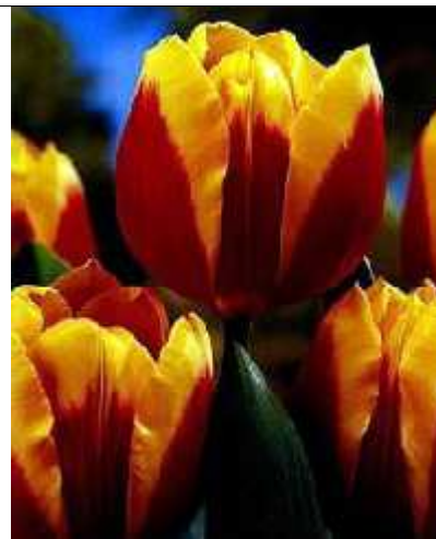
Slika 4. Tip Keizerkroon uvećano