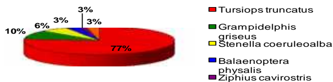
Grafikon 1. Vrste na ene u Jadranskom moru 2001./ 2002. godine

Osim procjenjivanja veličine i rasprostranjenosti populacije dobrog dupina u zadnjih dvadesetak godina istraživačkim brodicama, istraživanje se provelo i u dva navrata iz 4 mala aviona, kada je bio bilježen njihov položaj i broj. Velika populacija dobrog dupina, kao jedinog stalnog stanovnika Jadrana, procijenjena je na 250 jedinki rasprostranjenih po cijelom Jadranu. Prema istraživanjima u posljednjih desetak godina, ova se populacija s obzirom na prisutni broj životinja smatra stalnom (Gomer i sur. 1998).