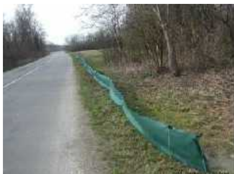
Slika 9.) Izgled mreže postavljene uz cestu

MREŽE – postavljaju se uz rub prometnica, na lokacijama s većim intenzitetom prelaska jedinki vodozemaca (Sl. 9.). Cilj im je usmjeriti vodozemce koji migriraju prema tunelu ili prema mjestu na kojem ih ljudi sakupljaju i prenose. Efikasnije su od prometnih znakova u osiguravanju populacije vodozemaca. Razlikuju se trajne mreže, koje zahtijevaju održavanje od obrastanja vegetacijom jednom godišnje, i privremene , koje je potrebno postavljati i uklanjati jednom godišnje (početkom sezone i nakon sezone migracija). Ovaj tip mreža zahtijeva organizirani angažman lokalnog stanovništva.