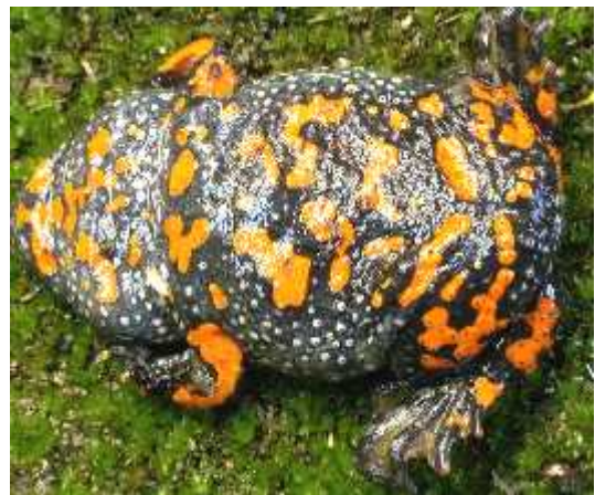
Slika 1.) Bombina bombina – crveni muka (dorzalna i ventralna strana)