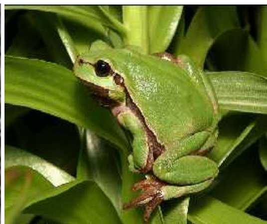
Slika 5.) Gatalinka potpuno prilago ena boji podloge