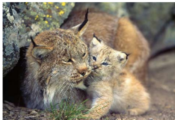
Slika 4. Vrsta Lynx lynx