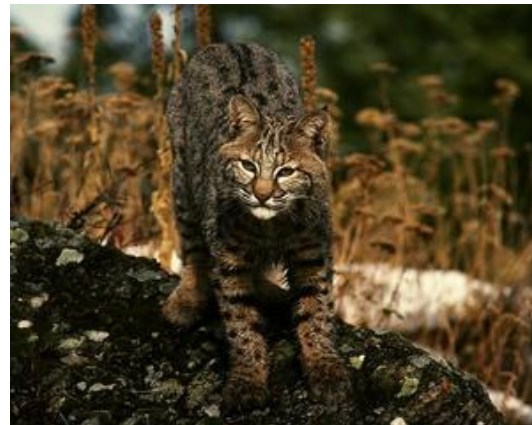
Slika 2. Vrsta Lynx rufus