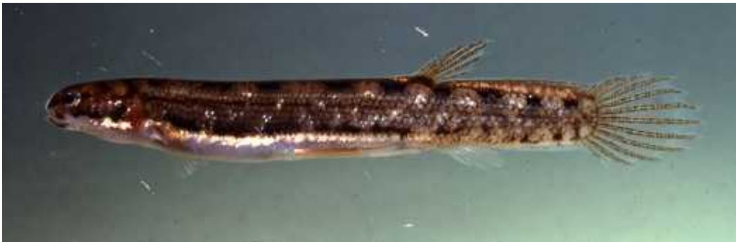
Slika 6. Lepidogalaxias salamandroides

Afrička dvodihalica u stanju mirovanja dušični otpad skladišti u obliku uree koja je manje otrovna od amonijaka, koji ribe proizvode u normalnim uvjetima (Wilkie i sur. 2007).