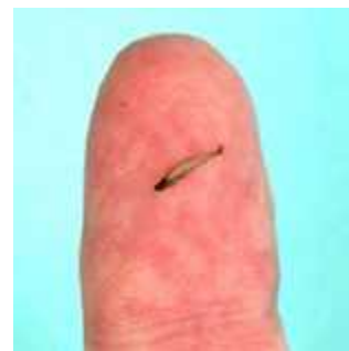
Slika 2. Paedocypris progenetica ( www.fishbase.org )