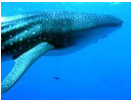
Slika 1. Rhincodon typus ( www.fishbase.org )

Iako takva mjesta osiguravaju vrlo malo uvjeta za razvoj života, ribe su im se uspjele prilagoditi. Evolucija je nevjerojatna sila koja savladava i najve e prepreke a pogotovo u tako dugom vremenskom razdoblju. Pogledamo li samo razliku izme u najve e (kitopsina, Rhincodon typus , dužina do 20 metara i teži do 34 tone, slika 1) i najmanje ( Paedocypris progenetica , dužina 1 cm, slika 2) ribe na svijetu, možemo tek naslutiti kakva je raznolikost me u ribama ( www.fishbase.org ).