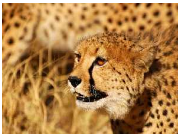
Slika 10. Acinonyx jubatus velox

Acinonyx jubatus velox ( Slika 10.) ili Kenijski gepard je najslabije istražena podvrsta geparda. Jedino što se zna o njemu je da je vi en u Africi i to na podru ju zapadne i isto ne Afrike, a najviše na podru ju Kenije po emu je i dobio nadimak. Dokazan je kao podvrsta i nakon toga je nestao, ali ipak vi en s vremena na vrijeme. Spada u kategoriju zaštite VU ( Osjetljivi) prema IUCN-ovoj listi zaštite.