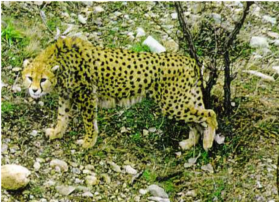
Slika 6. Acinonyx jubatus venaticus

Danas su ostali malobrojni primjerci koji su na rubu izumiranja zbog raznih razloga kao što su pretjerano izlovljavanje, krivolov, fragmentacija staništa zbog rudarskih aktivnosti i stvaranja poljoprivrednih površina, širenje pustinja te lova njihovog osnovnog plijena kojem se isto smanjuje broj ( gazele, neke vrste koza i ovaca). Osim tih životinja hrane se i malim antilopama te arapskim zecom Lepus capensis . Pokušava ih se klonirati i ponovno naseliti Indiju, ali je jako teško na i prikladno stanište za njih te je to gotovo nemogu e. Zbog svega toga Acinonyx jubatus venaticus je zašti ena vrsta sa statusom zaštite u kategoriji CR tj. kriti no ugroženi prema IUCN-ovoj listi zaštite što ozna ava iznimno visok rizik od izumiranja u neposrednoj budu nosti.