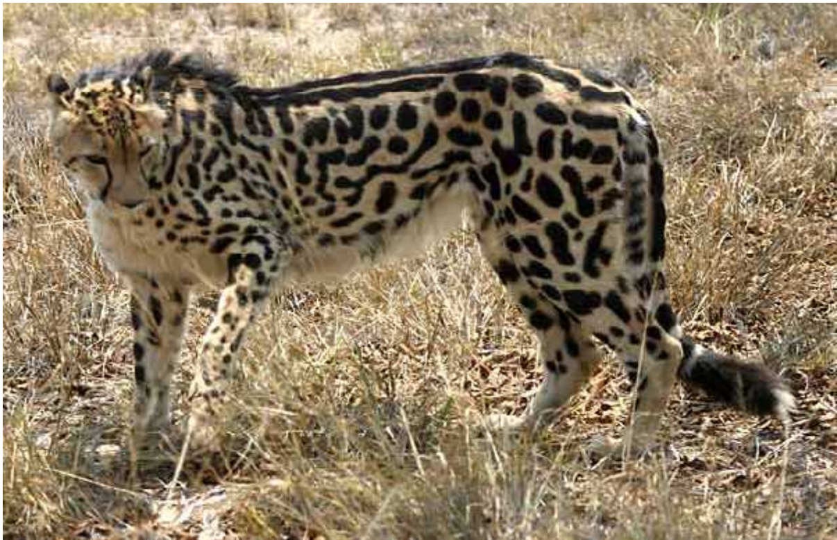
Slika 12. Kraljevski gepard

podvrsta nego samo rijetka mutacija nasljeđena jednim recesivnim genom (oba roditelja moraju imati taj gen da bi mladi bili takvi). Kraljevski gepard je jako rijedak, ima ga svega oko 30 jedinki u Zimbabveu, ali je važan zbog porasta genetičke diverziteta unutar potporodice Acinonychinae . (R. J. van Aarde, A. van Dyk 1986).