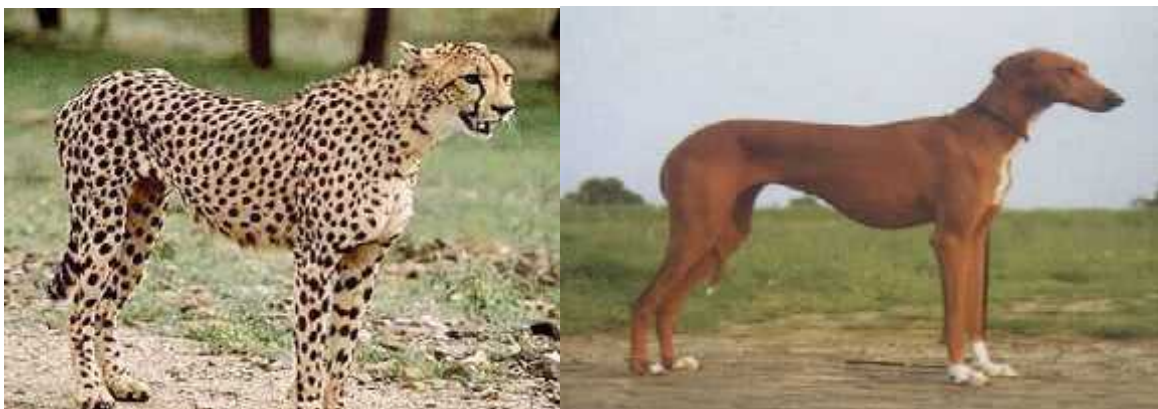
Slika 13. Sli nost tijela geparda i hrta