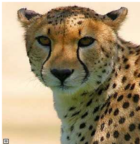
Slika 2. „Tear stripes“ na glavi geparda

Prosječna jedinka geparda teži do 60 kg, visoka je do 135 cm i ima do 90 cm duga ak rep. Osnovna boja krzna je žuta, a na truhu je prilično svjetlija. Krzno je prosuto velikim brojem malih, crnih, solitarnih pjega koje prekrivaju cijelo tijelo osim grla i trbuha. Glava je mala i okrugla sa licem koje je malo tamnije i bez pjega sa malim zubima i visoko postavljenim oči ima zbog proširenih nosnica. Glava im je uvijek fokusirana tj. okrenuta prema naprijed kao prilagodba na predatorski način života. Uši su također male i spljoštene. Na glavi nalazimo dvije crne pruge koje idu od oči do kuta usana (tzv. „tear stripes“) po kojima možemo razlikovati geparda od ostalih mačaka koje to nemaju. (D. W. Macdonald 2006).