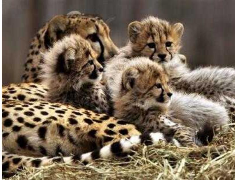
Slika 4. Majka sa mladima