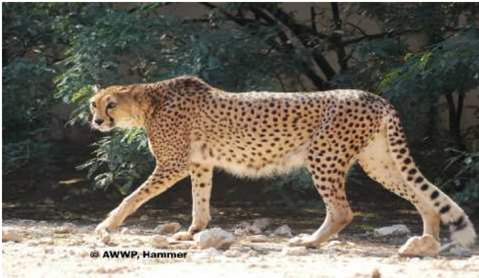
Slika 11. Acinonyx jubatus soemmerringii

Acinonyx jubatus soemmerringii ( Slika 11.) ili Sudanski gepard je posljednja podvrsta geparda o kojoj kao i o prethodne tri podvrste ne znamo gotovo ništa osim područja na kojem živi. Viđen je na području sjeveroistodne i centralne Afrike ( Sudan, Kamerun, Etiopija, Nigerija, Egipt, Somalija). Broji oko 500 jedinki od kojih najviše obitava na području Sudana. Specifična karakteristika za tu podvrstu su posebno intenzivne crne pjege po tijelu. Znanstvena istraživanja na temelju mitohondrijske DNA i sveukupne genetske diferencijacije pokazuju da se ova podvrsta na molekularnoj razini malo razlikuje od ostalih podvrsta koje su međusobno gotovo identične. ( P. Charrum 2011.) Kao i prethodne tri podvrste ubrajamo ga u kategoriju zaštite VU ( Osjetljivi) prema IUCN-ovoj listi zaštite.