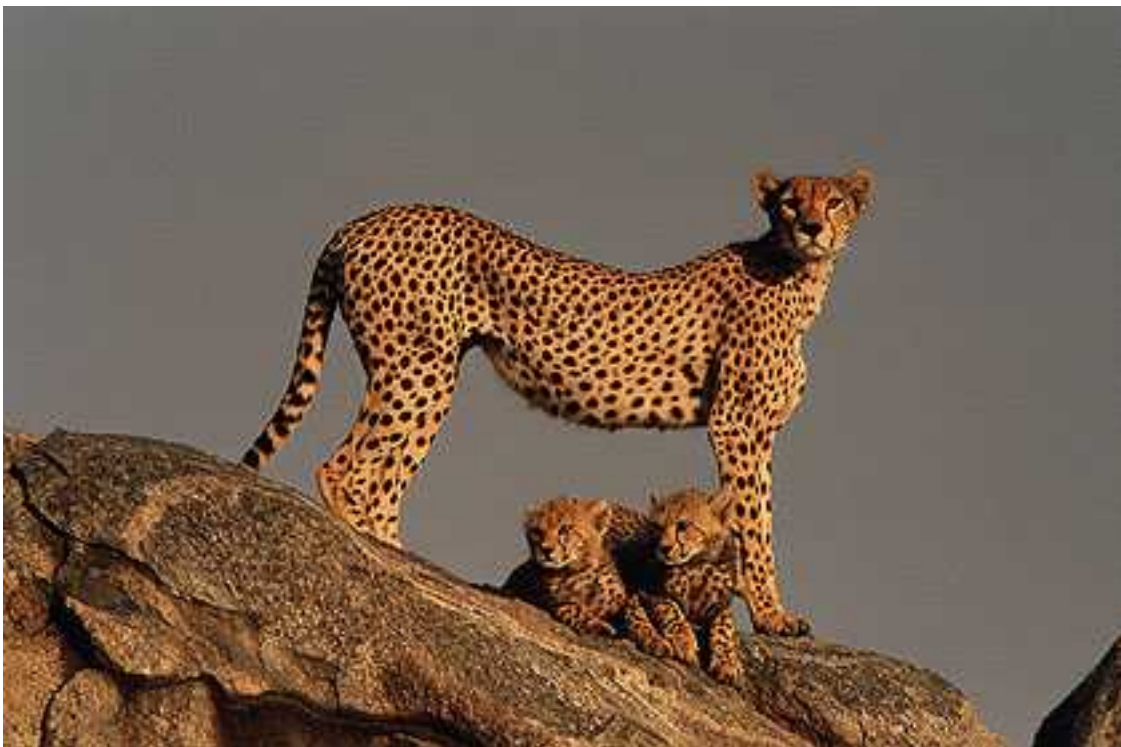
Slika 1. Gepard na uzvišenju promatra okolinu

Gepard je životinja savana ( travnjaci tropskog i subtropskog podneblja s rijetkim šumarcima stabala i grmlja). Osim savana nastanjuju i šume, brežuljke, planinska područja pa čak i pustinje ( Acinonyx jubatus hecki ), a kišna šuma je područje koje u potpunosti izbjegavaju. Daju prednost područjima s visokom travom koja pruža mogućnost prikrivanja i s uzvišenjima koja koriste kao mjesto s kojeg imaju dobar pogled na okolinu. Područja s puno stabala i grmlja nisu pogodna za geparde jer u takvom okolišu ne mogu u punoj mjeri iskoristiti svoju najveću prednost, a to je brzina.