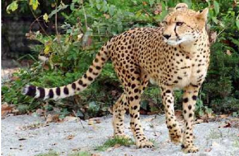
Slika 9. Acinonyx jubatus jubatus