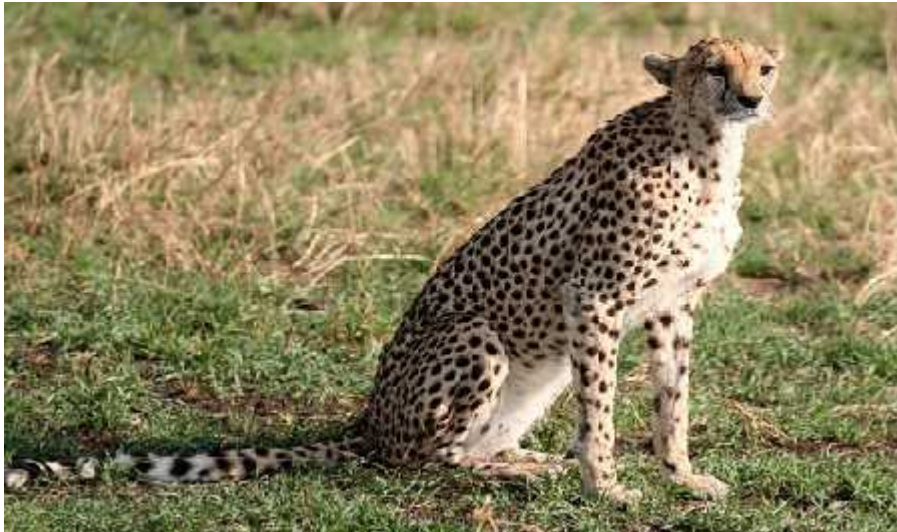
Slika 8. Acinonyx jubatus raineyii

njih u kategoriji je VU ( Osjetljivi) prema IUCN-ovoj listi zaštite što zna i da postoji visok rizik od izumiranja kroz umjereno razdoblje.