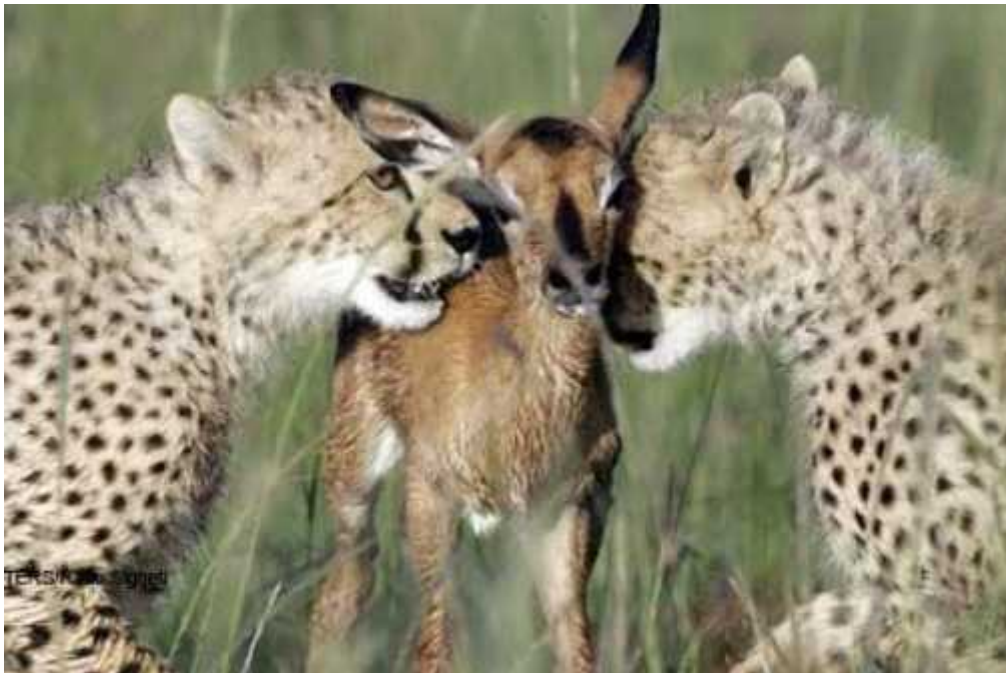
Slika 3. U enje lova na mladoj antilopi

Ženke žive same ili s mladima dok mužjaci lutaju u grupama od 3-4 jedinke ili sami. Sre u se samo u vrijeme parenja i odmah se razilaze. Ženke koje su spremne za parenje obilježe područje na kojem se nalaze urinom i tako privuku mužjake. ( Marker-Kraus, Kraus 1993). Oko jedne ženke se uvijek skupi ve i broj mužjaka, ali samo onaj najdominantniji osvoji ženku. Ženka živi s mladuncima dok ne odrastu i u i ih loviti nakon 5-6 tjedana starosti. U enje mladih lovu je jedna od specifi nih osobina geparda. Majka ulovi živu mladu životinju pr. gazelu da bi mladunci mogli vježbati lov. Pusti ju ispred njih te ih u i osnove lova: tiho prikradanje, kako srušiti plijen, kako ga ubiti jednim ugrizom za vrat, a isto tako u e savladati strah.