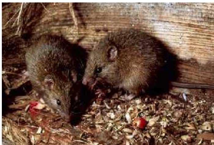
Slika 6. Kiore štakori ( http://www.teara.govt.nz/files/p16116doc.jpg )

Štakori se smatraju najozbiljnijom prijetnjom tuatarama jer se lako transportiraju već spomenutim plovilima, te su najčešće prve alohtone vrste koje neopaženo pristižu na nova staništa. Otoci sa štakorima imaju vrlo malo noćnih beskralješnjaka, vodozemaca i gmazova jer, u nedostatku hrane, oni opelješe njihove nastambe odnosno gnijezda, jedu i jaja i tek izlegle mladunce, ali i odrasle jedinke. Odrasli premosnici nemaju prirodnog neprijatelja i štakori ih rijetko napadaju, ali rade štetu za njihov reproduktivni uspjeh, što je za životinju sa usporenim životnim ciklusom i slabom stopom razmnožavanja, prilično pogubno.