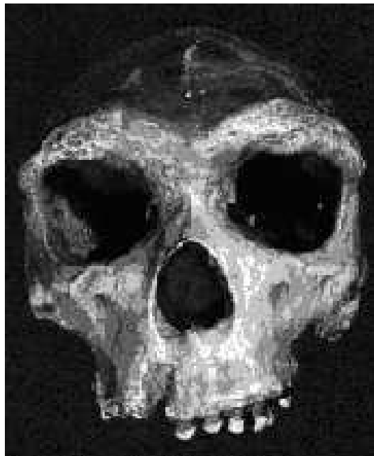
SLIKA 4. Lubanja Homo erectusa

grebeni, sagitalno zadebljanje i zatiljni torus su bile značajke koje je posjedovao Homo erectus , a nisu se javile ni kod ranijih hominida ni modernih ljudi. Volumen prosječne nog mozga iznosio je oko 1000 cc. Imali su dulje tijelo u odnosu na vrstu Homo habilis , no omjer volumena mozga i dužine tijela bili su slični onima kod ranijih hominida. Bili su prva vrsta koja je imala nos kakav nalazimo u modernih ljudi. Kulturni i socijalni život se isto tako razvijao. Stvaranje oružja za lov se postepeno usavršavalo te se na kraju dobio sofisticiraniji oblik oružja. Briga za potomstvo je također prešla na viši nivo, tako da su više vremena boravili na istom mjestu. Pronađeni su ostaci taborenja na otvorenom i skloništa za koje su koristili pećine. Sa potrebom za hranom i brigom za potomstvo možemo reći da je nastala i podjela rada između muškaraca i žena. Muškarci su odlazili u lov kako bi prehranili male obiteljske skupine, dok su žene ostajale na prebivalištima i brinule o djeci. Homo erectus je živio u doba izmjene interglacijala i glacijala. Pretpostavka je da je morao naučiti koristiti se vatrom kako bi preživio u zimskim uvjetima. Koristio je vatru i za pripremanje hrane. Smatra se da je vatra znatno doprinijela širenju iz Afrike u Aziju i Europu. S Homo erectusom se nastavlja obrada oblutaka. Pronađena je anatomska prilagodna spuštenu ždrijela te se smatra da je to bila prva vrsta koja je imala anatomske ustrojstvo za proizvodnju glasova.