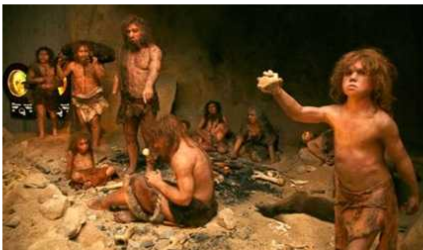
SLIKA 6. Rekonstrukcija populacije neandertalaca iz Krapine