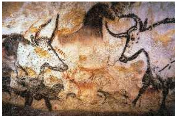
SLIKA 8. Zidna slika životinja iz spilje Lascaux u Francuskoj

( http://www.arheo-amateri.rs/2012/10/istorija/praistorija/paleolitska-religija/ )