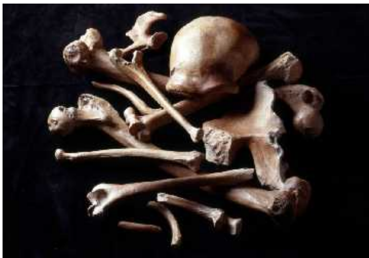
SLIKA 5. Kostii prona ene u dolini Neandertal u Njema koj 1856. godine

vrste Homo sapiens . Otprilike 1-4% suvremenog ljudskog genoma potječe od neandertalaca.