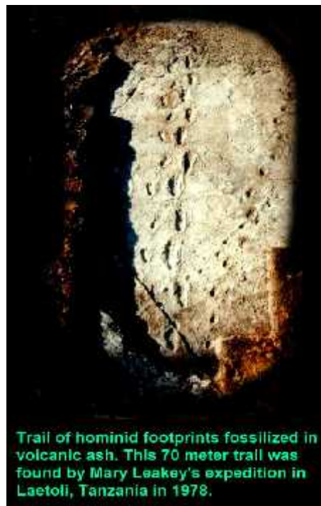
SLIKA 2. Stope hominida fosilizirane u vulkanskom pepelu

Razvoj dvonožnosti ili bipedalizma pokrenuo je evoluciju u smjeru nastajanja roda Homo . Oslobađanjem prednjih udova došlo je do poboljšane prilagodbe na uvjete okoliša te je popraćen nizom mnogih morfoloških promjena ostatka tijela. Kralješnjica je težila sve uspravnijem položaju što je u konačnici dovelo i do zaokretanja zdjelice prema naprijed. Zubi se prilagodili granivornoj i omnivornoj prehrani te se povećao sam volumen mozga. Tim morfološkim promjenama poboljšala se i sama kvaliteta života. Imali su bolji nadzor nad predatorima, bili su uspješniji u sakupljanju hrane, a mogli su se i koristiti oružjem u slučaju obrane, kao i u lovu životinja. Poboljšani su odnosi u društvu i obitelji, povećana skrb za potomstvo. Oponožnost palca dovela je do razvoja kulture. 1978. godine Mary Leakey dokazala je da stope koje su pronađene u vulkanskom tufu u Laetoliju, Tanzanija, prije 3,6 milijuna godina pripadaju ljudskim stopama (Sl.2.). U to doba vladali su oblici Australopithecusa za koje je utvrđeno da su imali razvijenu dvonožnost pa se pretpostavlja da te stope pripadaju upravo njima te da su oni prethodili razvoju Homo habilis .