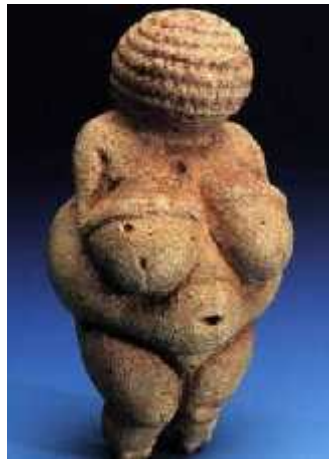
SLIKA 7. Willendorfska Venera

pridavali veliku važnost umjetnosti. Skulpturirali su, crtali i gravirali razne animalne i ljudske oblike na zidovima pećina (Sl.8.). Naučili su se koristiti raznim prirodnim tvarima, kao što su crveni i žuti oker, željezni oksidi i mangan, kako bi stvorili razne boje. Antropolozi su utvrdili da je čovjek iz kasnijeg Pleistocena dosegao starost od 60 godina, a žene su jedva dosezale starost od 40 godina. Smrtnost djece bila je velika. Stekli su bolji imunološki sustav za razliku od neandertalaca pa su bili manje podložni raznim bolestima i ozljedama. Izrađivali su sve kompleksnija skloništa od kostiju i krzna koja su ujedno koristila kako bi se ugrijali. Skloništa su naseljavale sve veće skupine ljudi koje su živjele zajedno te brinule jedne o drugima.