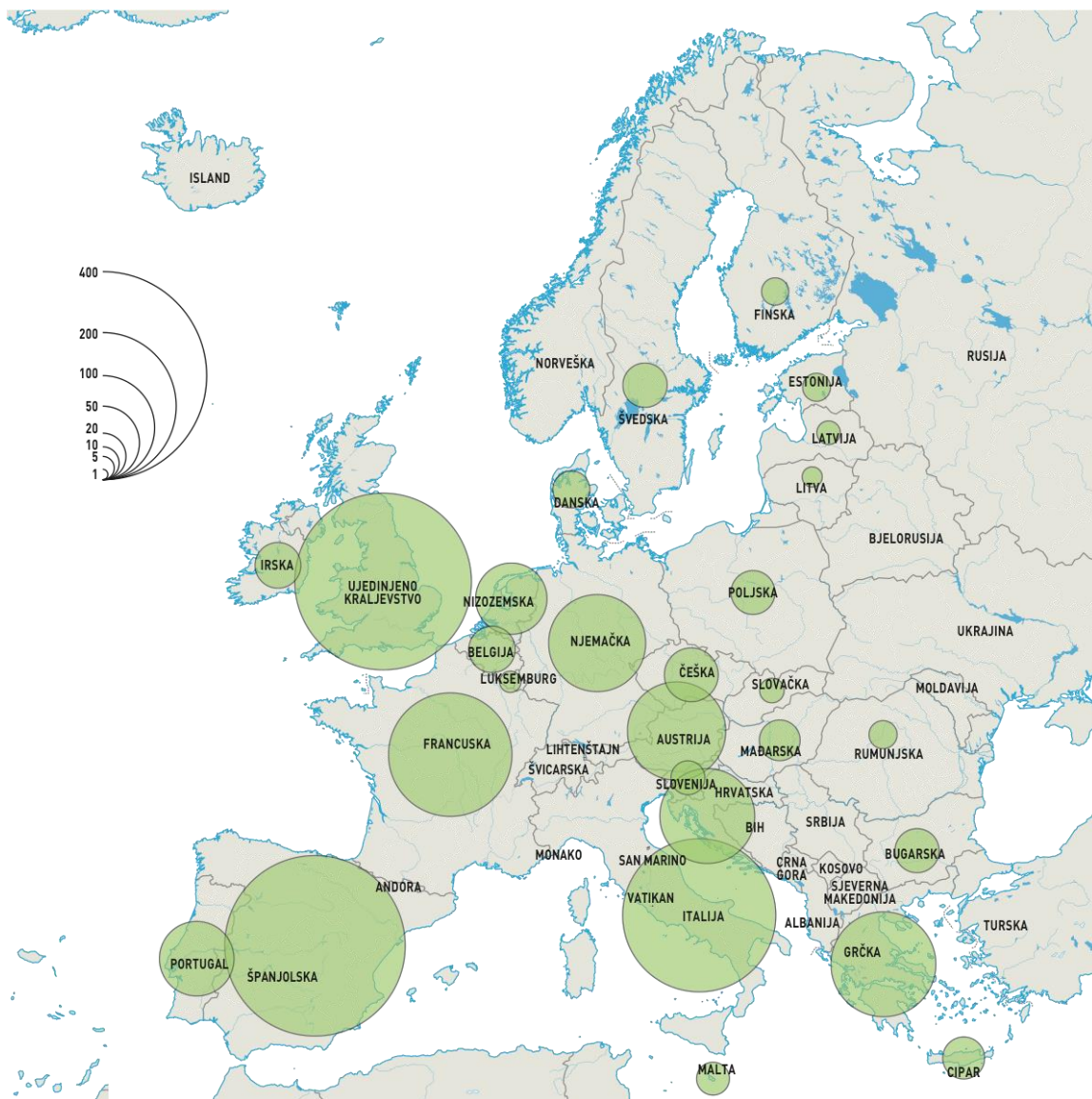
Karta 1. Prostorni raspored broja noćenja turista (u milijunima) u zemljama Europske unije 2018. godine

noćenja na tisuću stanovnika (Tablica 4.).