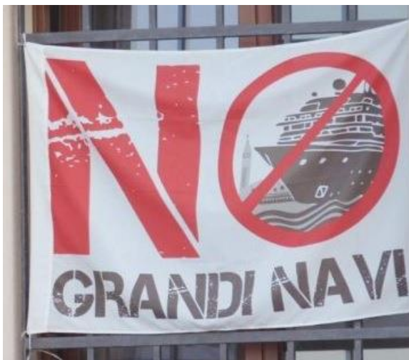
Slika 5. Transparent koji se koristi pri demonstraturama protiv turista u Veneciji

("ne veliki brodovi") održan 2016. godine. Prosvjed su organizirali stanovnici Venecije, jer im je konstantan dolazak velikih kruzera i neprestano iskrcavanje stanovništva dozlagrdilo. Mještani su zagrađili kanal Giudecca malim ribarskim brodovima kako bi blokirali prolaz kruzera. Još jedan veliki prosvjed dogodio se kada je stotine Venecijanaca prosvjedovalo protiv dolaska prevelikog broja turista, a s time i uništavanja njihove kvalitete života. Još jedan razlog prosvjeda je uzrokovan visokim zakupninama stanova, nestašicom ponude stambenog prostora, rastućom turističkom industrijom i cijenama svakodnevne potrošnje (Burgen, S., 2018).