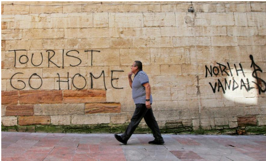
Slika 1. Grafit na zgradama «Torists go home», kao posljedica nezadovoljstva lokalnog stanovništva