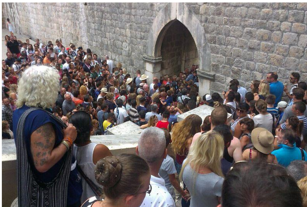
Slika 6. Ulaz kod Vrata od Pila prepun turista