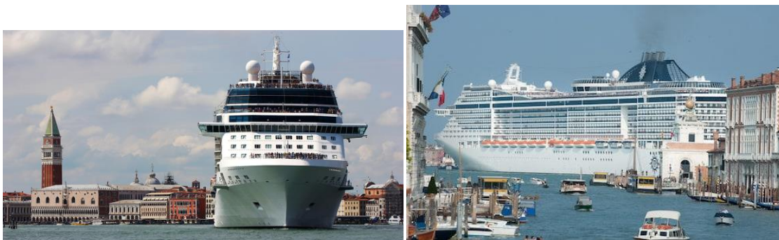
Slika 2. i 3. Brodovi za krstarenje su okupirali Veneciju

Godine 2017. u Veneciju je pristiglo 466 brodova za krstarenje i iskrcalo se 1.546.337 turista. Godine 2018. taj se broj povećao na ukupno 502 kruzera s 1.680.599 turista (Slika 2. i 3.).