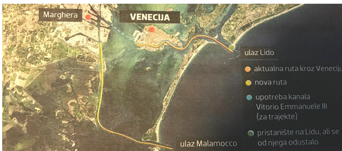
Slika 4. Prikaz alternativnog puta plovidbe kruzera u Veneciji

jedan. Naime, 2. lipnja 2019. godine, megakruzer MSC Opera naletio je na manji turistički brod kod venecijanskog bazena San Marco. Nasreću nitko nije poginuo, ali ranjeno je petero ljudi. Zbog čega se to dogodilo? Kanal Guidecca preuzak je da bi megakruzeri kroz njega mogli ploviti i vijugati vlastitim porivnim strojevima i kormilom, pa ih pokreću tegljači. Njihovo vučenje megakruzera, između desetke manjih brodova i brodića nije bilo uspješno. Stručno povjerenstvo grada predložilo je vladi Italije da brodovima ukupne težine stotinu i više tona, zabrani plovidbu kanalom Giudecca ispred Trga Sv. Marka i napravi alternativni put. Alternativni put je uplovljavanje kroz Vrata Malamocco, zatim plovidba Petrolejskim kanalom, desetak kilometara južno od Venecije. Kruzeri će pristai u industrijsku luku Marghere, a putnici će do grada morati malim brodovima posve nezanimljivim kanalom Vittorio Emmanuele III. (Slika 4.). Također je bilo prijedloga o potpunom ukidanju dolaska kruzera u Veneciju, ali to bi ostavilo posljedice za poslovanje. Potpuna zabrana ulaska brodova za krstarenje imala bi za grad i cijelu regiju teške gospodarske posljedice. Venecijanski terminal za kruzere lokalno zapošljava između četiri i pet tisuća ljudi ili 4% zaposlenih Venecijanaca (Večernji list). Također Venecija bi izgubila i prihode od turista koji troše novac u gradu. Međutim, teško je pokušati pronaći ravnotežu u gradu u kojem ga turizam oživljava dok ga istovremeno umrtvljuje.