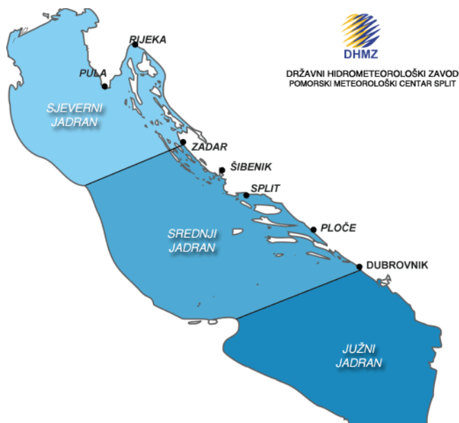
Slika 1.

Jadransko more, nazvano po lučkom središtu antike, Adriji, dio je Sredozemnog mora između Balkanskog i Apeninskog poluotoka. Pred kraj zadnjeg glacijala, prije 18 000 godina, ledenjaci se počinju otapati, a dugi sinklinalni Jadranski bazen se puni vodom koja je stizala kroz Otrantska vrata. 75 km široka Otrantska vrata spajaju Jadransko more s Jonskim, odnosno s ostatkom Sredozemlja. Vrhovi nekadašnjih planina tada su postali otoci, a doline zaljevi i morski prolazi. Kao posljedica, smjer pružanja otoka prati smjer pružanja planina na kopnu. Ti događaji uzrok su razvedenost obale Jadrana, a u cijelom se svijetu takav tip obale prema jadranskom modelu naziva dalmatinski tip obale. Njegova zatvorenost razlog je oligotrofnosti Jadranskog mora, ali specifični uvjeti sjevernog dijela učinili su taj dio mora jednim od najproduktivnijih područja u čitavom Sredozemlju. Rijeka Po (Pad) i druge alpske rijeke utječu u sjeverozapadni dio Jadrana i na taj način mijenjaju koncentraciju hranjivih tvar. Pod njihovi utjecajem je i slanost mora, koja je znatno niža na sjeverozapadnom dijelu bazena (35‰) nego na jugoistočnom (38‰).