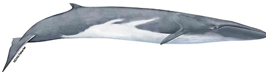
Slika 7. Veliki kit ( Balaenoptera physalus ).

Veliki kit ( Balaenoptera physalus ), jedini predstavnik kitova usana na Mediteranu, je široko rasprostranjena vrsta koja živi u svim oceanima i morima svijeta, osobito u umjereno hladnim i polarnim zemljopisnim širinama. Veliki kitovi žive uglavnom sami ili u manjim skupinama, a povremeno se opažaju skupine do stotinjak životinja u područjima koja su bogata hranom. Uglavnom se hrane planktonskim račićima (krill) i manjom plavom ribom, skušama, haringama i capelinima. Imaju hidrodinamički oblikovano tijelo s naboranim grlenim brazdama koje se tijekom hranjenja prošire. Sporim kretnjama kroz vodu hrane se širom otvorenih usta filtrirajući velike količine vode kroz usi. Poput drugih vrsta iz porodice Balaenopteridae, veliki kitovi hrane se ljeti, konzumirajući do jedne tone plijena dnevno, a poste u zimskom periodu. Jedini prirodni neprijatelji velikih kitova su kitovi ubojice. Veliki kit je druga po veličini životinja na Zemlji, a jedina od njega veća životinja je plavetni kit. Tijelo velikog kita je tamno sivo s gornje strane, a bijelo ili bež s donje strane. Ženke mogu narasti do 27 m dužine i težiti gotovo 100 tona ( Slika 7. ). Žive duže od 80 godina. Ženka u zimskim mjesecima koti samo jedno mladunče u prosjeku svake dvije do tri godine. Trudnoća traje 11 do 12 mjeseci.