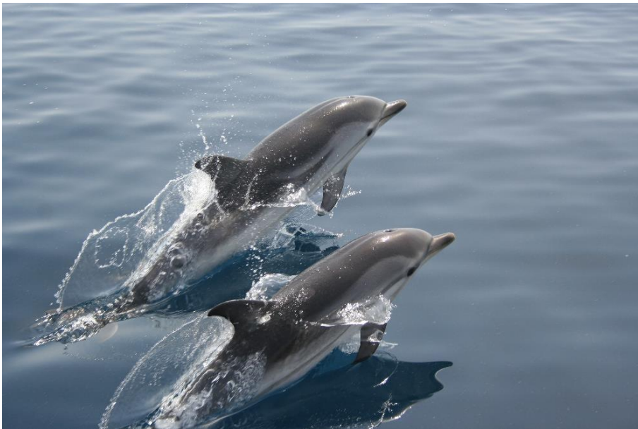
Slika 6. Prugasti dupin ( Stenella coeruleoalba ). Izvor:

Prugasti dupin ( Stenella coeruleoalba ) je mali pučinski dupin rasprostranjen širom svijeta u umjereno toplim i tropskim vodama. Najčešća je vrsta dupina u Sredozemnom moru. Otvorene vode južnog dijela Jadrana nastanjuje populacija od oko 20.000 jedinki. Samo povremeno ih se može opaziti u srednjem i sjevernom dijelu Jadrana u području otoka Lošinja i Krka ( https://www.plavi-svijet.org/zastita/vrste/kitovi/prugasti-dupin/ ). Ovaj raspored ukazuje na oceanografske karakteristike južnojadranske kotline jer prugasti dupin obično boravi u oceanskim dubinama većim od 600 metara, a u područjima s dubinama manjim od 200 metara se nalazi samo u iznimnim situacijama. To se dogodi kada jedna jedinka ili manja grupa jedinki zaluta u sjeverni dio bazena (UNEP/MAP, RAC/SPA, 2014).