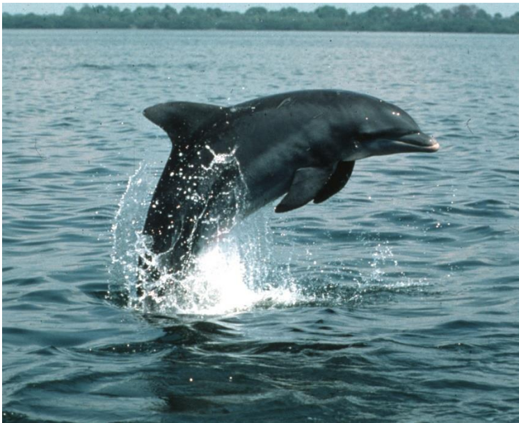
Slika 4. Dobri dupin ( Tursiops truncatus ). Izvor:

Dobri dupin ( Tursiops truncatus ) je vjerojatno najpoznatija i najrasprostranjenija vrsta iz skupine dupina (Delphinidae). Ima vretenasti odnosno hidrodinamičan oblik tijela. Boja tijela varira u nijansama od tamno sive na leđima preko svijetlo sive na bokovima i bijele na truhu. Tijekom ljeta kada je temperatura mora visoka trbuh može poprimiti ružičastu boju. Odrasle jedinke dobrih dupina dugačke su između 1,9 i 4 m i teže od 100 do 500 kg. U Jadranu, dobri dupini obično dosegnu do 3 m dužine i teže oko 200 kg ( https://www.plavi-svijet.org/zastita/vrste/kitovi/dobri-dupin/ ) (Slika 4.).