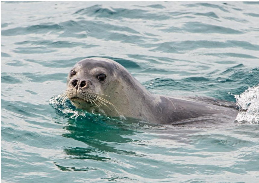
Slika 3. Sredozemna medvjedica ( Monachus monachus ). Izvor:

nalazimo kao usamljene jedinke ili u malim skupinama. Iako se općenito opisuje kao vrsta koja ima ograničeno područje kretanja, sposobna je prevaliti velike udaljenosti u kratkom vremenskom razdoblju ( https://www.plavi-svijet.org/zastita/vrste/sredozemna-medvjedica/ ). Spadaju u prave morske predatore, a hrane se raznim vrstama riba, hobotnicama i rakovima. Iako mogu zaroniti i preko 200 metara u dubinu, obično borave u plitkim obalni vodama, a rone do 18 minuta.