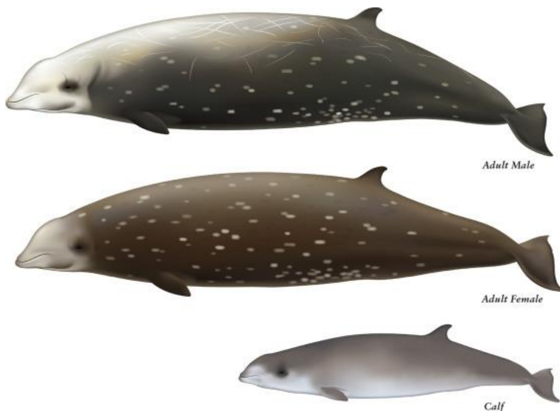
Slika 9. Cuvierov kljunasti kit ( Ziphius cavirostris ).