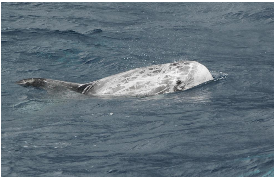
Slika 8. Glavati dupin ( Grampus griseus ).

Glavati dupin ( Grampus griseus ), vrsta kod koje jedinke oba spola narastu do oko 4 m u duljinu, je peti najveći član porodice Delphinidae. Naziva se još i Rissov dupin prema imenu prve osobe (M. Risso) koja ga je opisala francuskom prirodoslovcu Georges Cuvieru 1812. Glavati dupin neobično izgleda iz više razloga. Anteriorni dio tijela im je znatno kršan i sužava se prema repu, a uzimajući u obzir duljinu tijela, imaju jednu od najvećih repnih peraja od svih kitova. Njihova loptasta glava ima uočljiv vertikalni žlijeb ili nabor duž anteriorne površine melona (organ građen od masnog tkiva). Uzorci boje im se mijenjaju s godinama.