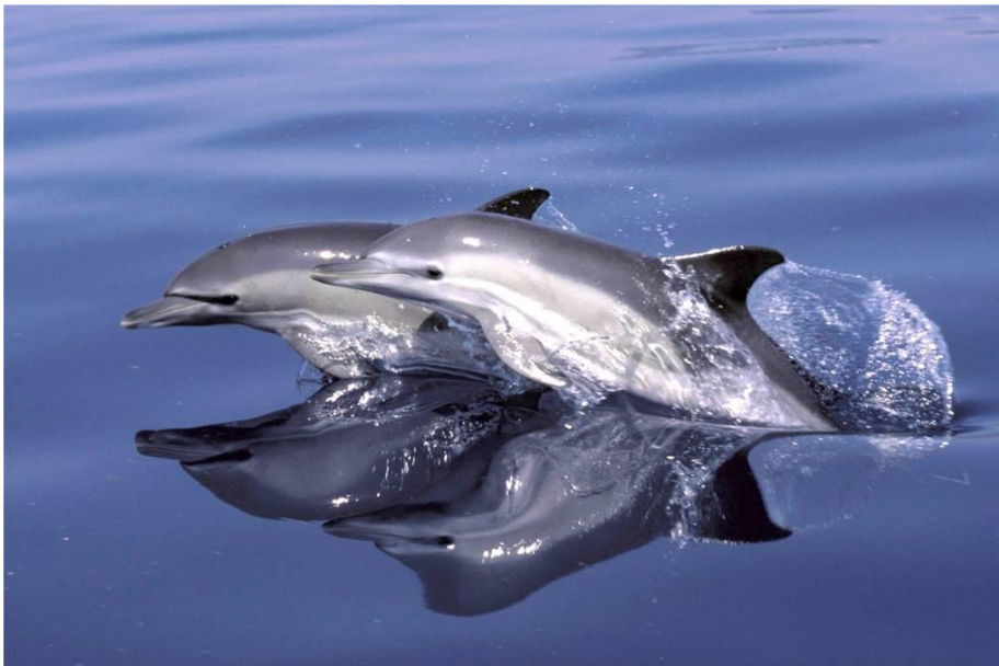
Slika 5. Kratkokljuni obični dupin ( Delphinus delphis ).

Kratkokljuni obični dupin ( Delphinus delphis ) je mala kozmopolitska vrsta kita. Nekada je bila raširena po Mediteranu i smatrala se najbrojnijom vrstom kita. Jedina preostala značajna populacija može se pronaći u Alboranskom moru. Obični dupini žive u pelagičkim i obalnim vodama (UNEP/MAP, RAC/SPA, 2014), a ovisno o staništu, hrane se različitom vrstom plijena. Prehrana im se sastoji od manje ribe koja se kreće u plovama, kao što su haringe, inćuni, srdele te glavonožaca ( https://www.plavi-svijet.org/zastita/vrste/kitovi/obicni-dupin/ ).