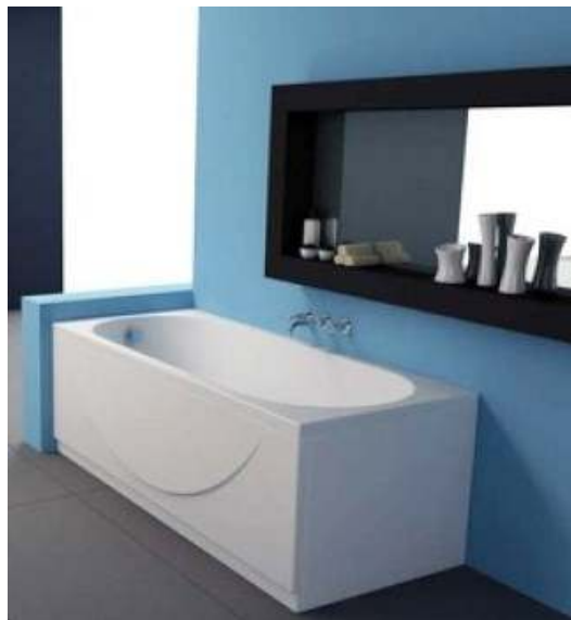
Slika br. 23: kada TAMIA