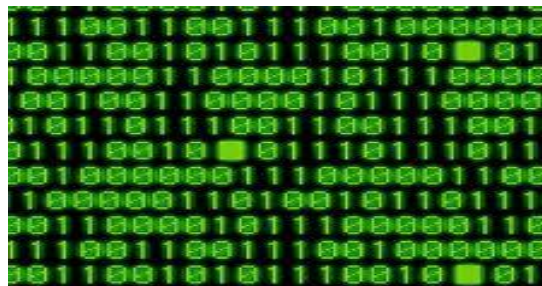
Slika 2: primjer računalnog programa u strojnom kôdu 10