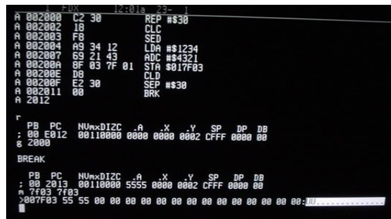
Slika 3: primjer računalnog programa u objektivnom kôdu 11