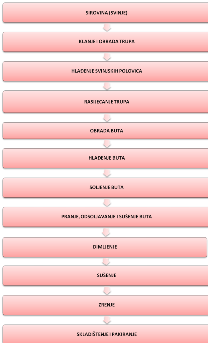
Slika 4 Tehnološka shema tehnologije proizvodnje Dalmatinskog pršuta

Minimalna masa Dalmatinskog pršuta mora iznositi najmanje 6,5 kg.