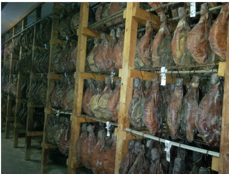
Slika 2 Zrenje Dalmatinskog pršuta

Nakon faze dimljenja i sušenja, pršuti se premještaju na zrenje u komore sa stabilnom mikroklimom koje imaju otvore za izmjenu zraka zbog pravilnog odvijanja tehnološkog procesa. Svi otvori moraju biti zaštićeni gustom mrežicom. U prostorijama za zrenje temperatura ne smije prelaziti 20 °C, a relativna vlaga zraka bude ispod 90%. U takvim mikroklimatskim prilikama pršuti ravnomjerno gube vlagu i pravilno zriju. Biokemijski procesi odvijaju se u optimalnim uvjetima, postiže se lijepa boja i pravilna harmonija mirisa i okusa. Oksidativnu stabilnost u pršutima tijekom zrenja povećava dodatak soli kao konzervansa (Toldra, 2002.). Faza zrenja se odvija u zamračenim prostorima uz blagu izmjenu zraka. Nakon godinu dana do dana početka soljenja pršut je zreo i spreman za konzumaciju, no unatoč konzumnoj zrelosti vrlo često Dalmatinski pršut podvrgava se produženom zrenju pri čemu ukupno trajanje procesa proizvodnje može biti 18 - 24 mjeseca.