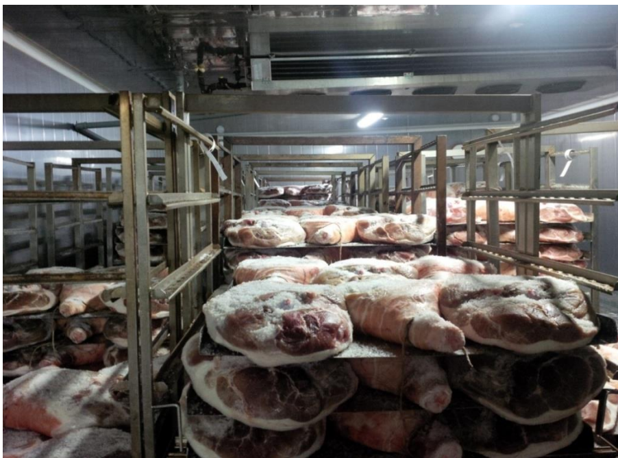
Slika 1 Soljenje Dalmatinskog pršuta