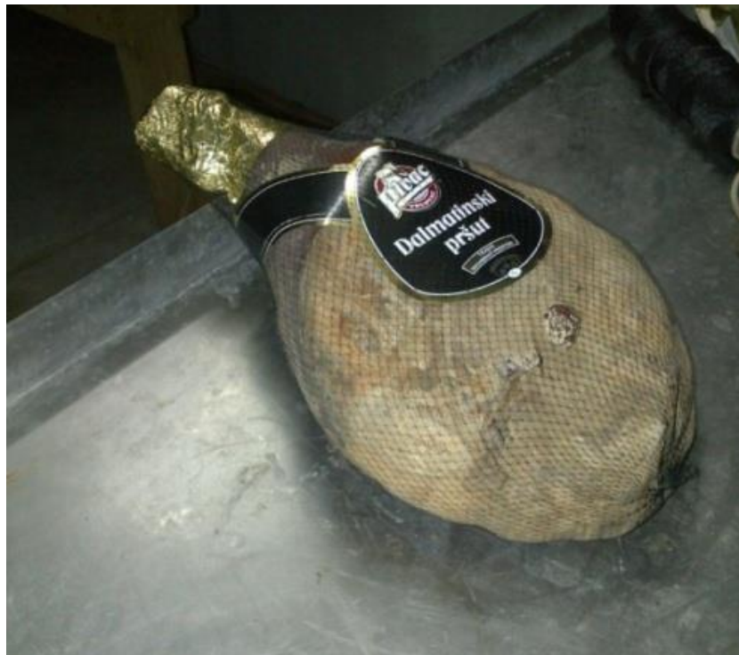
Slika 3 Upakiran Dalmatinski pršut

Proizvod se na tržište stavlja kao cijeli pršut, u komadima ili narezan, obično pakiran u vakuumu.