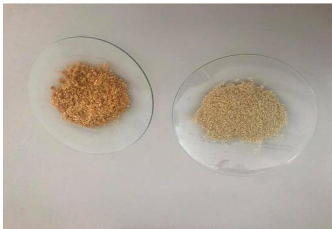
Slika 3 Uzorak ljuske bundeve prije modifikacije (lijevo) i nakon modifikacije (desno)

Kemijskom modifikacijom materijala postignuto je unakrsno povezivanje funkcionalnih grupa s epiklorhidrinom, etilendiaminom i trietilaminom. Masa sirovog materijala bila je 2 g, a nakon modifikacije dobilo se oko 10 g adsorbensa (Nujić, 2017). Slika 3 prikazuje nemodificiranu ljusku bundeve (lijevo) i ljusku bundeve nakon modifikacije (desno).