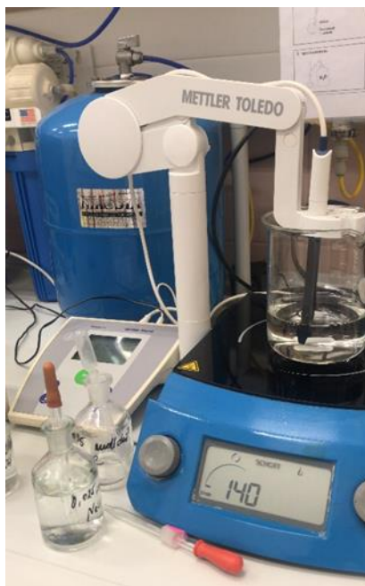
Slika 6 pH metar Seven Easy (Mettler Toledo)

jedinice211. pH-metar je svakodnevno kalibriran, prije početka mjerenja, puferima pH 4,01 i pH 7,00 (Reagecon, Irska).