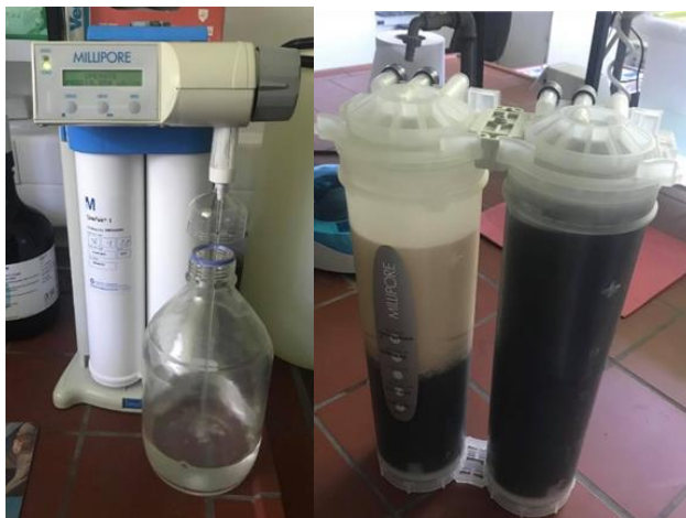
Slika 2 Uređaj za dobivanje vode visoke čistoće (lijevo) i filtri koji se nalaze u uređaju (desno)

minuta na 70 °C. Dodano je 2,5 mL etilendiamina te se nastavilo s miješanjem sljedećih 45 minuta. Nakon toga, dodano je 13 mL trietilamina te je miješanje nastavljeno idućih 120 minuta na 70 °C. Finalni proizvod (modificirana ljuska bundeve) isprana je s 1 L demineralizirane vode visoke čistoće (milli-Q, Merck) kako bi se isprao višak kemikalija. Slika 2 prikazuje uređaj za dobivanje vode visoke čistoće (a) i pod (b) su filtri koji se nalaze u uređaju.