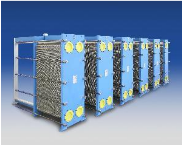
Slika 1 Pločasti izmjenjivači topline (web 1)

ambalaže u koju se pakira i kapacitetu proizvodnj. Za sterilizaciju tekućih i polutekućih namirnica, kod kojih se proces sterilizacije pretežno vrši prije punjenja u ambalažu, upotrebljavaju se različiti izmjenjivači topline (pločasti, cijevni, s brišućom površinom) (Lovrić, 2003.).