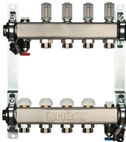
Slika 4.3 Prikaz odabranog razdjelnika

Odabrana su i dva razdjelnika za podno grijanje. Za prizemlje je potreban razdjelnik s 12 krugova grijanja. Odabran je model HERZ Inox TO 312 (slika 4.3). Njegove tehničke značajke prikazane su na slici 4.5.