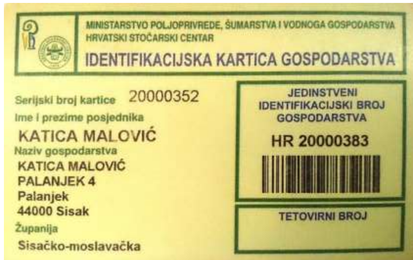
Slika 1. Iskaznica obiteljskog poljoprivrednog gospodarstva

Važnu ulogu ima Hrvatska poljoprivredna agencija - HPA koja sadrži potrebne podatke o stoci i MIBPG 2 koji ima ulogu šifre kojom se elektronski razmjenjuju podaci. Kao dokaz upisa u Upisnik poljoprivrednih gospodarstava nositelj i članovi dobivaju iskaznicu obiteljskog poljoprivrednog gospodarstva koja vrijedi uz osobnu iskaznicu.