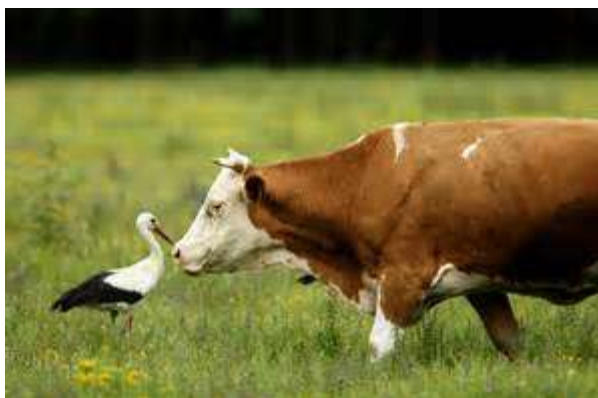
Slika 4. Bioraznolikost pašnjaka Lonjskog polja