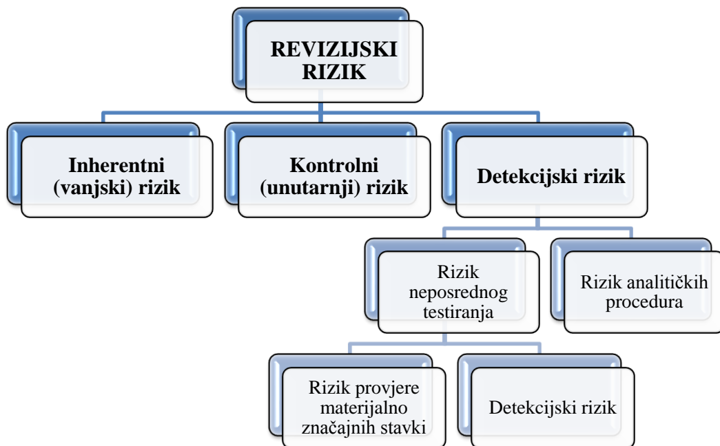
Slika 2.: Struktura revizijskog rizika