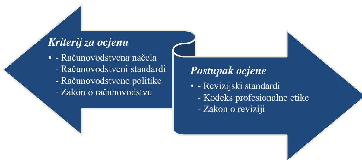
Slika 1.: Kriteriji i postupak ocjene financijskih izvještaja

Uz opisano, važno je spomenuti i kriterije te postupak ocjene financijskih izvještaja. Naime, uvijek se ističe kako su temeljni kriteriji za ocjenu izvješća računovodstvena načela, računovodstveni standardi, računovodstvene politike te zakoni, dok su i revizijski standardi, Zakon o reviziji, kao i Kodeks profesionalne etike revizora od velike važnosti kod postupka ocjene. „Revizorsko društvo dužno je sastaviti revizorsko izvješće o obavljenoj zakonskoj reviziji godišnjih financijskih izvještaja ili godišnjih konsolidiranih financijskih izvještaja u skladu s Međunarodnim revizijskim standardima, odredbama ovoga Zakona i drugim propisima.“ 19 Slikovit prikaza opisanog se nalazi na slici niže.