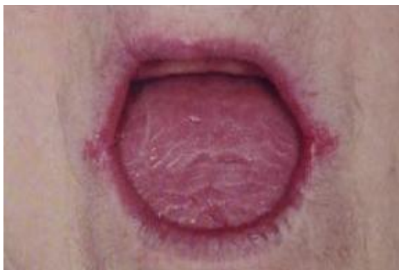
Slika 3. Kserostomija i cheilitis angularis. Preuzeto iz (5).

Oralne gljivične infekcije, uglavnom povezane s Candidom albicans te bakterijske infekcije žlijezda slinovnica, ubrajaju se među posljedice kserostomije (slika 3). Mogućnost infekcije još je veća kod pacijenata koji pate od dijabetesa, nose proteze ili puše. Imunosupresivni lijekovi i kortikosteroidi također povećavaju vjerojatnost infekcije (1).