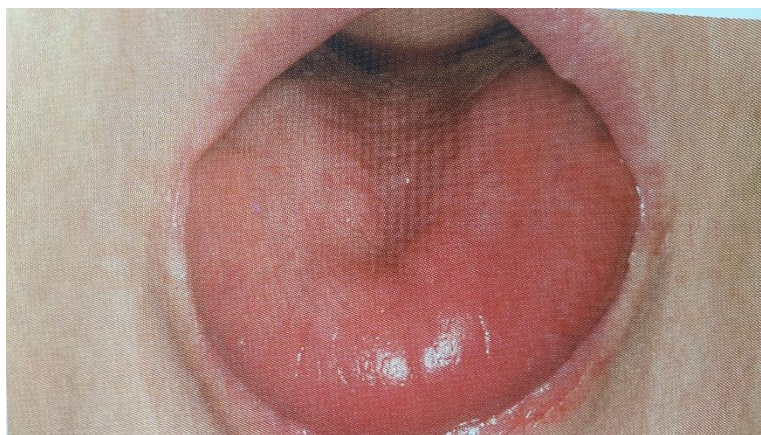
Slika 7. Akutna atrofična kandidijaza. Preuzeto: (17)

Kod astmatičara koji glukokortikoide uzimaju inhalacijom kroz usta često dolazi do razvoja orofaringealne kandidijaze. (11) Čest je slučaj i kod autoimunih bolesti žlijezda slinovnica čija je glavna manifestacija kserostomija, a posljedično i kandidijaza. (7)